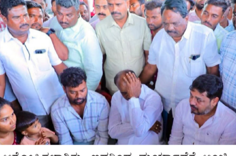
ಹಾಕಿಕೊಳ್ಳಬೇಕು. ಸಂತ್ರಸ್ತ ಕುಟುಂಬಕ್ಕೆ ಸೂಕ್ತ ಪರಿಹಾರ ಕೊಡಬೇಕು ಎಂದು ಆಗ್ರಹಿಸಿದ್ದರಿಂದ ಕೆಲಕಾಲ ಗೋದಲದ ವಾತಾವರಣ ಸೃಷ್ಟಿಯಾಯಿತು.