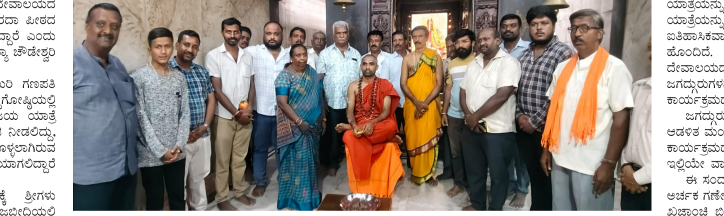
ಭಾನುವಾರ ಬೆಳಿಗ್ಗೆ 8ಂಟಿಗೆ ಶ್ರೀ ಚಂದ್ರಮೌಳೇಶ್ವರ ಪೂಜೆ ನಡೆಸಲಿದ್ದಾರೆ. ಇದಾದ ಬಳಿಕ ಚತುರ್ದಶಿ ಮಹಾಕುಂಭಾಭಿಷೇಕದ ಅಂಗವಾಗಿ ಹೋಮ ನಡೆಯಲಿದ್ದು, ಜಗದ್ಗುರುಗಳ ಅಮೃತ ಹಸ್ತದಿಂದ ಶ್ರೀ ಬಲಮುರಿ ಮಹಾಕುಂಭಾಭಿಷೇಕ ಹಾಗೂ ಮಹಾಪೂಜೆ ನಡೆಯಲಿದೆ. ನಂತರ ಗುರುಗಳಿಂದ ಅನುಗ್ರಹ ಭಾಷಣ ಹಾಗೂ ಫಲ ಮಂತ್ರಾಕ್ಷತೆ, ನೀಡಲಿದ್ದಾರೆ. ಜತೆಗೆ ಅನ್ನಸಂತರ್ಪಣೆಯನ್ನು ಸಹ ಏರ್ಪಡಿಸಲಾಗಿದೆ ಎಂದು ಜಗದ್ಗುರುಗಳು ಜೂನ್ ತಿಂಗಳಲ್ಲಿ ಧರ್ಮ ವಿಜಯ