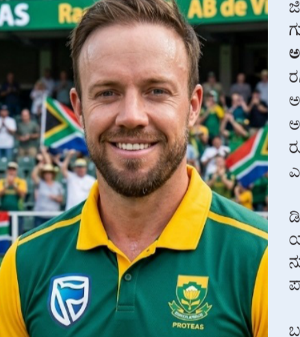
ಅದರ ಆ ಕಣ್ಣಿನಿಂದ ಅವರನ್ನು ಸೋಲಿಸಿಲ್ಲ; ಬದಲಿಗೆ ಮತ್ತಷ್ಟು ಬಲಪಡಿಸಿತು. ಸಣ್ಣ ಸೋಲಿಗೆ

ದೃಶ್ಯಗೋಚರ ಇಂದಿನ ಯುವಕರಿಗೆ, ವೈಫಲ್ಯಗಳನ್ನು ಜೀರ್ಣಿಸಿಕೊಂಡು ಪ್ರಚೀದನವನ್ನು ಎಬಿಡಿಎಂವರ ಗುಣ ದೊಡ್ಡ ಪ್ರೇರಣೆ. ಅವರು ಕೇವಲ ಕ್ರಿಕೆಟರ್‌ಗಳು; ಟೆನ್ನಿಸ್, ಹಾಕಿ ಮತ್ತು ರಗ್ಬಿಯಲ್ಲೂ ಮಿಂಚಿದ್ದರು. ಪ್ರತಿ ಕ್ರೀಡೆಯಿಂದ ಅವರು ಕಲಿತ ಶಿಸ್ತು ಮತ್ತು ಸಮಯಪ್ರಜ್ಞೆ ಅವರನ್ನು ಒಬ್ಬ ಪರಿಪೂರ್ಣ ಆಟಗಾರನನ್ನಾಗಿ ರೂಪಿಸಿತು. ಪರಿಶ್ರಮಕ್ಕೆ ಯಾವುದೂ ಅಸಾಧ್ಯವಲ್ಲ ಎಂಬುದನ್ನು ಅವರು ನಿರೂಪಿಸಿದರು. ಎಷ್ಟೇ ದಾಖಲೆಗಳನ್ನು ಬರೆದರೂ ಡಿವಿಲಿಯರ್ಸ್ ಸದಾ ವಿನಮ್ರರಾಗಿದ್ದರು. ಆಟಕ್ಕಿಂತ ಯಾರೂ ದೊಡ್ಡವರಲ್ಲ ಎಂಬ ಅವರ ನಡೆ ಮತ್ತು ನುಡಿ ಯುವಜನರಿಗೆ ಘನತೆಯಿಂದ ಬದುಕುವ ಪಾಠ ಕಲಿಸುತ್ತದೆ. ಸವಾಲಿಗಳು ನಮ್ಮನ್ನು ಮುರಿಯಲು ಬರುವುದಿಲ್ಲ, ನಮ್ಮೊಳಗಿನ ಶಕ್ತಿಯನ್ನು ಎಚ್ಚರಿಸಲು ಬರುತ್ತವೆ ಎಂಬುದಕ್ಕೆ ಈ ಫಲದ ಹರಿಕಾರನೇ ಅತ್ಯುತ್ತಮ ಉದಾಹರಣೆ.