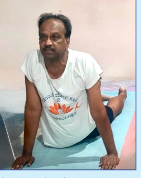
ಸರ್ವೇಗಿರಿ ಅಂತರರಾಷ್ಟ್ರೀಯ ಯೋಗ ದಿನ ಸುಭಾಷಿಯಗಳು!

ಆರೋಗ್ಯಕರವಾಗಿ ಹೊಂದಿಕೊಂಡು ಬದುಕುವುದು. ಆರೋಗ್ಯದ ಮಹತ್ವ ??? ಉತ್ಪಾದಕ ಹೆಚ್ಚಳ ಉತ್ತಮ ಆರೋಗ್ಯವುಳ್ಳ ವ್ಯಕ್ತಿಗಳು ಯಾವುದೇ ಕೆಲಸದಲ್ಲಿ ಹೆಚ್ಚು ಕ್ರಿಯಾಶೀಲರಾಗಿ, ಉತ್ತಮದಿಂದ ಭಾಗವಹಿಸಿ ಉತ್ಪಾದಕತೆಯನ್ನು ಹೆಚ್ಚಿಸಲು ಸಾಧ್ಯವಾಗುತ್ತದೆ. ದೀರ್ಘಾಯುಷ್ಯ ಮತ್ತು ಆರ್ಥಿಕ ಬೆಳವಣಿಗೆ: ಆರೋಗ್ಯವಂತ ಜನಸಂಖ್ಯೆಯು ಆರ್ಥಿಕ ಪ್ರಗತಿಗೆ ಗಮನಾರ್ಹವಾಗಿ ಕೊಡುಗೆ ನೀಡುತ್ತದೆ ಮತ್ತು ವೈದ್ಯಕೀಯ ವೆಚ್ಚಗಳನ್ನು ಕಡಿಮೆ ಮಾಡುತ್ತದೆ. ಸಂತೋಷ ಮತ್ತು ನಮ್ಮ ದೈಹಿಕವಾಗಿ ಮತ್ತು ಮಾನಸಿಕವಾಗಿ ಸದೃಢವಾಗಿರುವುದು. ಜೀವನದ ಪ್ರತಿಯೊಂದು ಕ್ಷಣವನ್ನು ಆನಂದಿಸಲು ಸಾಧ್ಯವಾಗುತ್ತದೆ. ಆರೋಗ್ಯವನ್ನು ಕಾಪಾಡಿಕೊಳ್ಳುವ ಸರಳ ಮಾರ್ಗಗಳು ಸಮತೋಲಿತ ಆಹಾರ: ಹಣ್ಣುಗಳು, ತರಕಾರಿಗಳು, ಮತ್ತು ಪೋಷಕಾಂಶಭರಿತ ಆಹಾರ ಸೇವನೆ. ದೈಹಿಕ ಚಟುವಟಿಕೆ: ಪ್ರತಿನಿತ್ಯ ವ್ಯಾಯಾಮ ಅಥವಾ ಯೋಗ ಮಾಡುವುದು. ಉತ್ತಮ ನಿದ್ರೆ: ಕನಿಷ್ಠ 7-8 ಗಂಟೆಗಳ ಗಾಢ ನಿದ್ರೆ. ಪ್ರತಿದಿನ ಮುಂಜಾನೆ ಬೆಳಿಗ್ಗೆ 5:15, ಯಾರು ಬಲಿಲೇ ಬಿಡಲಿ, ಹೊಳೆನರಸೀಪುರದ ಪುರಸಭೆಯ ಗ್ರಂಥಾಲಯದ ಬಳಿಯೇ ಇರುವ ಪತಂಜಲಿ ಯೋಗ ಕೇಂದ್ರದಲ್ಲಿ ಮೇಲ್ನಿಂದ ಪ್ರಾರ್ಥನೆಯೊಂದಿಗೆ ಯೋಗ