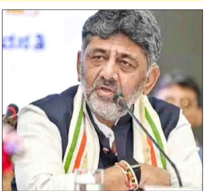
ಡಿ.ಕೆ.ಶಿವಕುಮಾರ್ ಪತ್ರಿಕಾಗೋಷ್ಠಿ ಹೇಳಿಕೆ

ಈ ಸಚಿವಾಲಯಕ್ಕೆ ಪ್ರತ್ಯೇಕವಾದ ಸಚಿವರು ಇರುತ್ತಾರೆ. ಅಲ್ಲದೆ, ಐಎಎಸ್ ಅಧಿಕಾರಿಯನ್ನು ನಿಯೋಜನೆ ಮಾಡುತ್ತೇವೆ. ಎಲ್ಲ ಸಚಿವರು, ಜಿಲ್ಲಾ ಸಚಿವರು ಪ್ರತಿ 224 ಕ್ಷೇತ್ರಗಳಿಗೆ ಪ್ರತಿವಾರ ಕಡ್ಡಾಯವಾಗಿ ಹೋಗಿ ಆ ತಾಲೂಕುಗಳಲ್ಲಿ ಜನಸ್ತಂದನಾ ಸಭೆ ನಡೆಸಬೇಕು. ಜನಹಿತ ಬಹಳ ಮುಖ್ಯ. ನಾವು ಯಾರೂ ಸರ್ವಜ್ಞರಲ್ಲ. ಜನರಿಗೆ ಹಲವು ಸಮಸ್ಯೆ ಎದುರಾಗುತ್ತದೆ. ಮಾಧ್ಯಮಗಳಲ್ಲಿ ಸಾರ್ವಜನಿಕ ಸಮಸ್ಯೆಗಳನ್ನು ಹೇಳುತ್ತಾರೆ. ಅದನ್ನೆಲ್ಲ ಸಮನ್ವಯತೆ ಮಾಡಿ ಸ್ಪಂದಿಸಲು ಈ ಸಚಿವಾಲಯದ ಮೂಲಕ ಕ್ರಮ ತೆಗೆದುಕೊಳ್ಳಲಾಗುವುದು ಎಂದು ಮುಖ್ಯಮಂತ್ರಿ ತಿಳಿಸಿದರು.