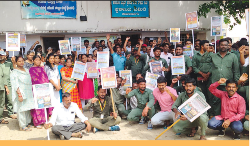
ಶತಮಾನದ ಇತಿಹಾಸವಿರುವ ಸಂಸ್ಥೆಯ ಮಾರಾಟಕ್ಕೆ ವಿರೋಧ

ಚಿಟಿಕಾಂ ಕ್ಷೇತ್ರದ ದುಸ್ಥಿತಿಯ ಎಚ್ಚರಿಕೆ ಕಳೆದ ನಾಲ್ಕು ವರ್ಷಗಳಲ್ಲಿ ವಿದ್ಯುತ್ ಖಾಸಗೀಕರಣ ವನ್ನು ವಿರೋಧಿಸಿ ಕೆಇಬಿ ನೌಕರರ ಸಂಘದ ವತಿಯಿಂದ ಈಗಾಗಲೇ 3-4 ಬಾರಿ ಪ್ರತಿಭಟನೆ ನಡೆಸಲಾಗಿದ್ದರೂ, ಪ್ರಸ್ತುತ ವಿದ್ಯುತ್ ಕ್ಷೇತ್ರಕ್ಕೆ ಖಾಸಗೀಕರಣದ ಭೀತಿ ಎದುರಾಗಿದೆ. ಟಾಟಾ ಪವರ್ ಕಂಪನಿಯು ರಾಜ್ಯದಲ್ಲಿ ವಿದ್ಯುತ್ ಪೂರೈಕೆ ಮಾಡಲು ಅನುಮತಿ ಕೋರಿ ಅರ್ಜಿ ಸಲ್ಲಿಸಿರುವುದು ಇದಕ್ಕೆ ಸ್ಪಷ್ಟ ಸಾಕ್ಷಿಯಾಗಿದೆ. ಖಾಸಗೀಕರಣದಿಂದಾಗಿ ಚಿಟಿಕಾಂ ಕ್ಷೇತ್ರವು ಇಂದು ಸಂಪೂರ್ಣವಾಗಿ ಯಾವ ಮಟ್ಟಕ್ಕೆ ತಲುಪಿದೆ ಮತ್ತು ಬಿಎಸ್‌ಎನ್‌ಎಲ್ ಸಂಸ್ಥೆಗೆ ಎಂತಹ ಪರಿಸ್ಥಿತಿ ಬಂದೊಂದಿದೆ ಎಂಬುದನ್ನು