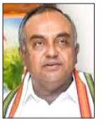
ಮೈಸೂರು ವಿಧಾನ ಪರಿಷತ್ ಚುನಾವಣೆ ವ್ಯವಸ್ಥಿತ ಪಡ್ಡೆಗಳ ನಡೆಯುತ್ತಿವೆ.