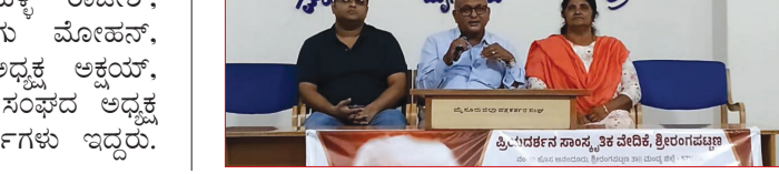
ಶ್ರೀಮಹಾಗಣಪತಿ, ಶಕ ವೇದಿಕೆ, ಶ್ರೀರಂಗಪಟ್ಟಣ