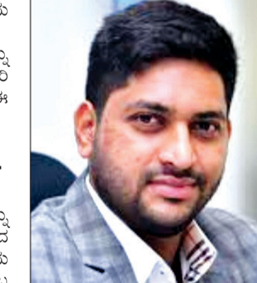
ಡಾ. ಶೋಬಿತ್ ರಂಗಪ್ಪ ಅವರು.

ಮೈಸೂರು: ಮೈಸೂರು ಮೂಲದ ವಿಜ್ಞಾನಿ ಡಾ. ಶೋಬಿತ್ ರಂಗಪ್ಪ ಅವರು ಅಂತರರಾಷ್ಟ್ರೀಯ ಮಟ್ಟದಲ್ಲಿ ಮತ್ತೊಂದು ಮಹತ್ವದ ಸಾಧನೆ ಮಾಡಿದ್ದಾರೆ. ಸಿಯರ್ಸ್ ಗ್ಲೋಬಲ್ ಸೈನ್ಸಿಸ್ಟ್ ಇನ್ಸ್ಟಿಟ್ಯೂಟ್ 2025 ಪ್ರಕಟಿಸಿರುವ ಜಾಗತಿಕ ವಿಜ್ಞಾನಿಗಳ ಪಟ್ಟಿಯಲ್ಲಿ ಅವರು ವಿಶ್ವದ ಅಗ್ರ 5 ಶೇಕಡಾ ವಿಜ್ಞಾನಿಗಳಲ್ಲಿ ಸ್ಥಾನ ಪಡೆದಿದ್ದಾರೆ.