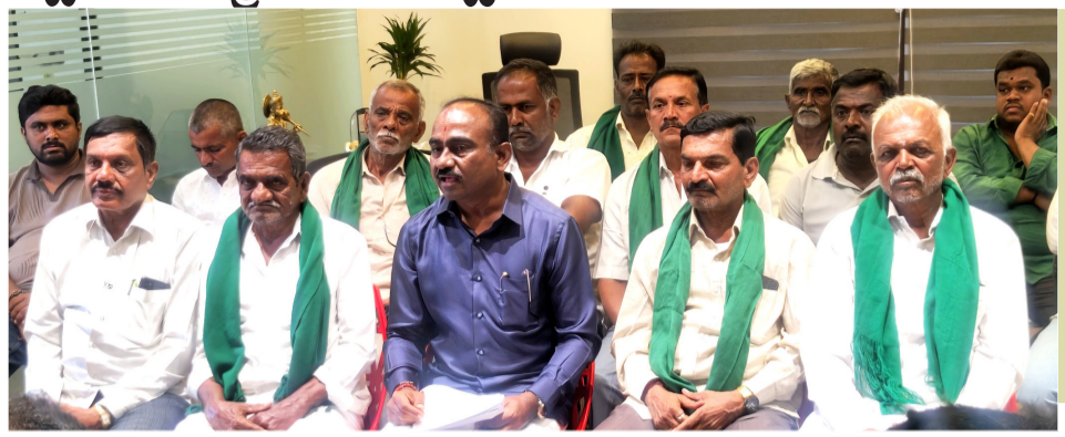
ಬಿಡದಿ ಇಲ್ಲದವರ ಸಂಖ್ಯೆಗಿಂತ ಹೆಚ್ಚಾಗಿದ್ದರೆ, ಯೋಜನೆ ಮುಂದುವರಿಯಲು ನಮ್ಮ ತಕಾರರು ಏನೂ ಇಲ್ಲ. ಹಾಗೂಮೈ ಒಪ್ಪಿಗೆ ಇಲ್ಲದವರ ಸಂಖ್ಯೆ ಹೆಚ್ಚಾಗಿದ್ದರೆ, ಸರ್ಕಾರ ಭೂಸ್ವಾಧೀನವನ್ನು ಕೈಬಿಡಲಿ ಎಂದರು.