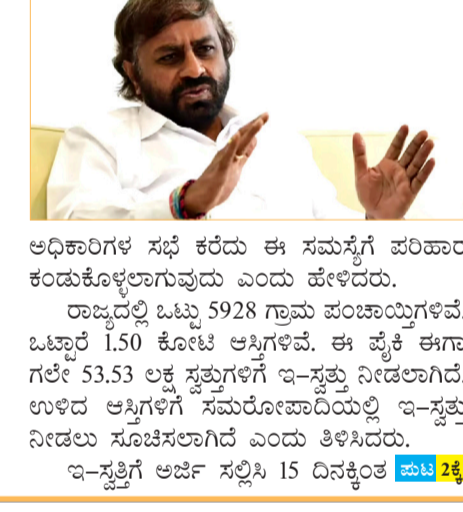
ಇ-ಸ್ವತ್ತಿಗೆ ಅರ್ಜಿ ಸಲ್ಲಿಸಿ 15 ದಿನಕ್ಕಿಂತ ಮುನ್ನ