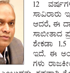
ಎಂಬುದನ್ನು ಸ್ಪಷ್ಟವಾಗಿ ತೋರಿಸುತ್ತವೆ ಎಂದು

ಬೆಂಗಳೂರು: ಜಾರಿ ನಿರ್ದೇಶನಾಲಯದ ದಾಳಿ ಮತ್ತು ಸಿಬಿಐ ಕೇಂದ್ರ ಸರ್ಕಾರದ ಕೈಗೊಂಡ ಶಿಕ್ಷಣ ಬಗ್ಗೆ ಗೃಹ ಸಚಿವ ತ್ರಿಯಾಂಕ್ ಖರ್ಗೆ ಕಳವಳ ವ್ಯಕ್ತಪಡಿಸಿದರು.