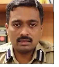
ರದ್ದಿಯೂ ಕೂಡ ಇವರನ್ನು ಇರಿಸಲಾಗಿದೆ.