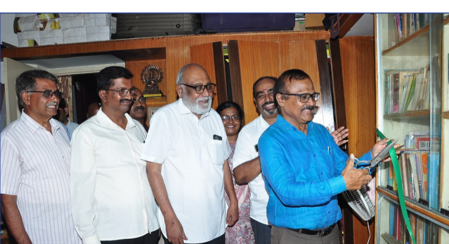
ಓದುವುದೂ ಒಂದು ಕ್ರಮ. ಕಂಠಪಾಠ ಮಾಡುವುದರಿಂದ ಉಚ್ಚರಣೆಯ ದೋಷ ಕಡಿಮೆಯಾಗುತ್ತದೆ. ಓದಿದಾಗ ಮನಸ್ಸು ಉಲ್ಲಾಸಗೊಂಡು ಆದ್ರಗೊಳ್ಳುತ್ತದೆ. ಸಂಸ್ಕಾರ, ವಿಶಾಲ ಮನೋಭಾವ ಬೆಳೆಯುವುದು ಎಂದು ತಿಳಿಸಿದರು. ಮೊಟ್ಟಮೊಟ್ಟಮು ಏಕೆ ಬಳಸಬೇಕು, ಎಷ್ಟು ಬಳಸಬೇಕು, ಊಟ ಹೇಗೆ ಮಾಡಬೇಕು, ನಡೆ ನುಡಿ ಹೇಗೆರಬೇಕು,