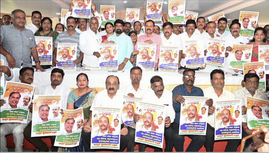
ಸಿದ್ದರಾಮಯ್ಯನವರಿಗೆ ಮೊದಲ ಹಂತದಲ್ಲೇ ಸೂಕ್ತ ಸ್ಥಾನಮಾನ ನೀಡುವಂತೆ ಮನವಿ ಮಾಡಿದರು. ಕರ್ನಾಟಕ ಪ್ರದೇಶ ಕುರುಬ ಸಂಘ ಮತ್ತು ಮೈಸೂರು ನಗರ, ಜಿಲ್ಲಾ, ತಾಲೂಕು ಕುರುಬ ಸಂಘದ ವತಿಯಿಂದ ನಡೆದ ಸಭೆಯಲ್ಲಿ ಪ್ರಮುಖ