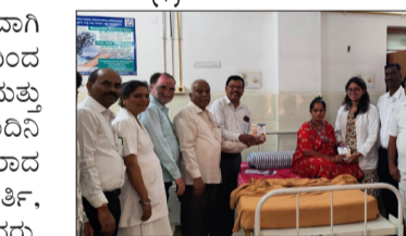
ಸರ್ಕಾರಿ ಅಸ್ಪತ್ರೆಯಲ್ಲಿರುವ ತಾಯಿ ಮತ್ತು ಮಕ್ಕಳಿಗೆ ಹಾಲು ವಿತರಣೆ ಮಾಡುತ್ತಾ ಬಂದಿದೆ. ರೈತರ ಸಂಸ್ಥೆಯಾಗಿರುವ ಚಾಮುಲ್ ಬೆಳವಣಿ ಗೆಂಯಿಂದ ಜಿಲ್ಲೆಯ ಅಭಿವೃದ್ಧಿಯಾಗುತ್ತದೆ. ಗುಣಮಟ್ಟದ ಹಾಲು ಗ್ರಾಹಕರಿಗೆ ದೊರೆಯುವ ಜೊತೆಗೆ ಇದರ ಸಂಪೂರ್ಣ ಲಾಭ ನಮ್ಮ ಜಿಲ್ಲೆಯ ರೈತರಿಗೆ ಸೇರುತ್ತದೆ. ಹೀಗಾಗಿ ಪ್ರತಿಯೊಬ್ಬರು ನಂದಿನಿ ಹಾಲು ಬಳಕೆ ಮಾಡಿ ಎಂದು ಮನವಿ ಮಾಡಿದರು.