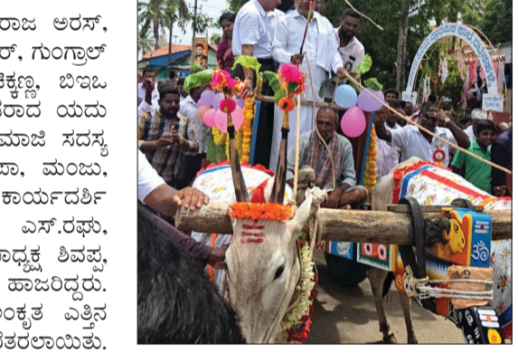
ಮರವಣಿಗೆ ಮೂಲಕ ಕರೆತಂದಾಗ ಶಾಲಾ ಶಿಕ್ಷಕರು ಸ್ವಾಗತಿಸಿ ಬರಮಾಡಿಕೊಂಡರು.

ಎಸ್‌ಎಸ್‌ಎಲ್‌ಸಿ ಪರೀಕ್ಷೆಯಲ್ಲಿ ಮೈಸೂರು ತಾಲ್ಲೂಕು ಮೊದಲ ಸ್ಥಾನ ಪಡೆದಿದೆ. ದುಡಿಯುವ ಕೆಲಸಗಳಿಗೆ ಉದ್ಯೋಗ ದೊರೆಯಬೇಕು. ಮಕ್ಕಳಿಗೆ ಬರೀ ಶಿಕ್ಷಣ ಕೊಡಿಸುವುದು ಮುಖ್ಯವಲ್ಲ. ಭವಿಷ್ಯದ ನಾಯಕರಾಗುವ ಮಕ್ಕಳಿಗೆ ಸಂಸ್ಕಾರಯುತ ಶಿಕ್ಷಣ ಕೊಡಿಸಬೇಕು. ಮಕ್ಕಳು ಮನೆಯಲ್ಲೇ ಪೋಷಕರು, ಶಾಲೆಯಲ್ಲಿ ಗುರುಗಳಿಗೆ ಗೌರವ ಕೊಡುವಂತೆ ನೀತಿ ಕಲಿಸಬೇಕು.