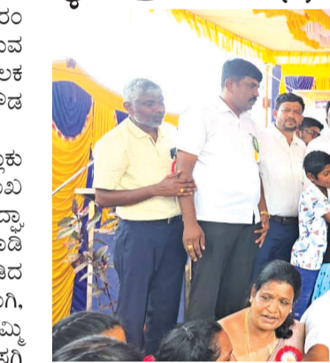
ನೂತನ ಶಾಲಾ ಕೊಠಡಿಗಳ ನಿರ್ಮಾಣ, ಶುದ್ಧ ಕುಡಿಯುವ ನೀರಿನ ಘಟಕ ನಿರ್ಮಾಣ ಮಾಡಿಸಿಕೊಟ್ಟಿದ್ದಾರೆ. ಶುದ್ಧ ಕುಡಿಯುವ ನೀರಿನ ಘಟಕ ನಿರ್ಮಾಣ ಮಾಡುವುದನ್ನು ಸರ್ಕಾರ ನಿಲ್ಲಿಸಿಬಿಟ್ಟಿದೆ. ಹಾಗಾಗಿ ಖಾಸಗಿ ಸಂಸ್ಥೆಗಳ ನೆರವಿನಿಂದ ಶಾಲೆಗಳಿಗೆ ಕುಡಿಯುವ ನೀರಿನ ಘಟಕ ನಿರ್ಮಿಸಿ ಕೊಡಲಾಗುತ್ತಿದೆ ಎಂದರು.

ನಾಯಿ ಗಾರ್ಮೆಂಟ್ಸ್ ದೇವರಾಜ ಅರಸ್ ರಟ್ಟುಗಲ್ ಗ್ರಾಮಕ್ಕೆ 50ಲಕ್ಷ ರೂಪಾಯಿ ವೆಚ್ಚದಲ್ಲಿ