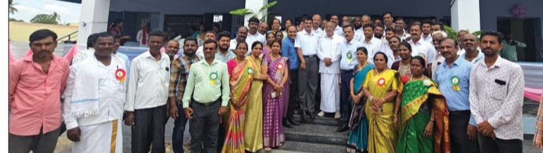
ಮರವಣಿಗೆ ಮೂಲಕ ಕರೆತಂದಾಗ ಶಾಲಾ ಶಿಕ್ಷಕರು ಸ್ವಾಗತಿಸಿ ಬರಮಾಡಿಕೊಂಡರು.