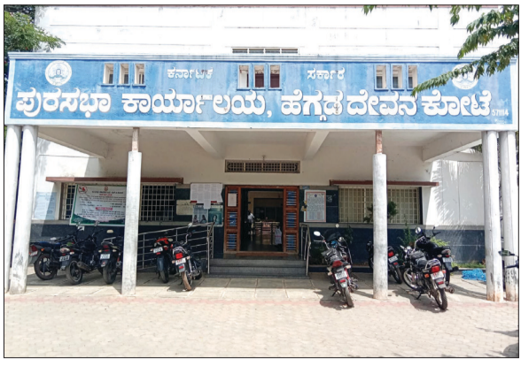
ಪುರಸಭೆ ಕಾರ್ಯಾಲಯ, ಹೆಗ್ಗಡೆ ವೇವನ ಕೋಟೆ