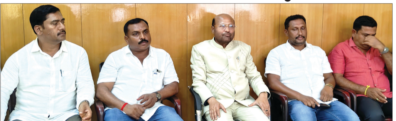
ಅಭಿವೃದ್ಧಿಯ ಮುಂದಿನ ಭಾಗ ಆರಂಭ!