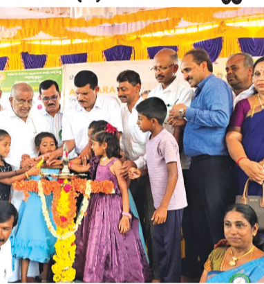
ಮರವಣಿಗೆ ಮೂಲಕ ಕರೆತಂದಾಗ ಶಾಲಾ ಶಿಕ್ಷಕರು ಸ್ವಾಗತಿಸಿ ಬರಮಾಡಿಕೊಂಡರು.

ಎಸ್‌ಎಸ್‌ಎಲ್‌ಸಿ ಪರೀಕ್ಷೆಯಲ್ಲಿ ಮೈಸೂರು ತಾಲ್ಲೂಕು ಮೊದಲ ಸ್ಥಾನ ಪಡೆದಿದೆ. ದುಡಿಯುವ ಕೆಲಸಗಳಿಗೆ ಉದ್ಯೋಗ ದೊರೆಯಬೇಕು. ಮಕ್ಕಳಿಗೆ ಬರೀ ಶಿಕ್ಷಣ ಕೊಡಿಸುವುದು ಮುಖ್ಯವಲ್ಲ. ಭವಿಷ್ಯದ ನಾಯಕರಾಗುವ ಮಕ್ಕಳಿಗೆ ಸಂಸ್ಕಾರಯುತ ಶಿಕ್ಷಣ ಕೊಡಿಸಬೇಕು. ಮಕ್ಕಳು ಮನೆಯಲ್ಲೇ ಪೋಷಕರು, ಶಾಲೆಯಲ್ಲಿ ಗುರುಗಳಿಗೆ ಗೌರವ ಕೊಡುವಂತೆ ನೀತಿ ಕಲಿಸಬೇಕು.