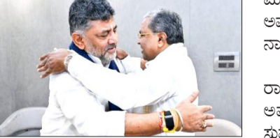
ಜಿಲ್ಲೆಯ ಹಳ್ಳಿಯೊಂದರಲ್ಲಿ ಹುಟ್ಟಿ, ಬೆಳೆದು, ಹೋರಾಡಿದ ಮೂಲಕ ರಾಜಕೀಯಕ್ಕೆ ಬಂದು, ಸಾಮಾಜಿಕ ನ್ಯಾಯದ ಹರಿಕಾರ ಹಾಗೂ ಬಡವರ ಬಂಧುವಾಗಿ ಮುಖ್ಯಮಂತ್ರಿಯಾಗಿ ಸೇವೆ ಸಲ್ಲಿಸಿದ ನನ್ನ ಆತ್ಮಿಯರಾದ ಸಿದ್ದರಾಮಯ್ಯ ಅವರು ಸಿಎಂ ಸ್ಥಾನಕ್ಕೆ ರಾಜೀನಾಮೆ ನೀಡಿದ್ದಾರೆ. ಕರ್ನಾಟಕದ ರಾಜಕೀಯ ಇತಿಹಾಸದಲ್ಲಿ ಅತ್ಯಂತ ಯಶಸ್ವಿ, ಪ್ರಭಾವಶಾಲಿ ಹಾಗೂ ದೀರ್ಘಾವಧಿ ಮುಖ್ಯ

ಬೆಂಗಳೂರು: ದೇವರು ವರವನ್ನೂ ಕೊಡಲ್ಲ, ಶಾಪವೂ ಕೊಡಲ್ಲ. ಅವಕಾಶ ಮಾತ್ರ ಕೊಡುತ್ತಾನೆ. ಕೊಟ್ಟಿರುವ ಅವಕಾಶದಲ್ಲಿ ನಾವು ಏನು ಸಾಧನೆ ಮಾಡುತ್ತೇವೆ ಎಂಬುದು ಮುಖ್ಯ. ಇದಕ್ಕೆ ಅತ್ಯುತ್ತಮ ಉದಾಹರಣೆಯೇ ಸಿದ್ದರಾಮಯ್ಯನವರು ಎಂದು ಡಿ.ಕೆ.ಶಿವಕುಮಾರ್ ಭಾವುಕ ಸಂದೇಶ ಹಂಚಿ ಕೊಂಡಿದ್ದಾರೆ. ಸಿಎಂ ಸಿದ್ದರಾಮಯ್ಯ ರಾಜೀನಾಮೆ ಅಂಗೀಕಾರವಾದ ಬೆನ್ನಲ್ಲಿ ಎಕ್ಸಿಲಿನ್ ಸುದೀರ್ಘ ಸಂದೇಶ ಹಂಚಿಕೊಂಡಿರುವ ಅವರು ಸಿದ್ದರಾಮಯ್ಯ ಅವರ ಗುಣಗಾನ ಮಾಡಿದ್ದಾರೆ. ಅಲ್ಲದೆ, ಸಿದ್ದು ಹಾಗೂ ತಮ್ಮ ನಡುವಿನ ಬಾಂಧವ್ಯಕ್ಕೆ ಸಾಕ್ಷಿಯಾಗುವ ವಿಶೇಷ ವಿಡಿ ಯೋಜನೆಯನ್ನು ಹಂಚಿಕೊಂಡಿದ್ದಾರೆ. ಡಿ.ಕೆ.ಶಿವಕುಮಾರ್ ಸಂದೇಶದಲ್ಲಿ ಏನಿದೆ: ಮೈಸೂರು