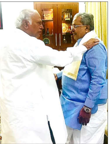
ದೆಹಲಿಯಲ್ಲಿ ಭೋಜನ: ಸಿದ್ದು-ಡಿ.ಕೆ.ಶಿವಕುಮಾರ್ ಚರ್ಚೆ ನವದೆಹಲಿ: ಹೊಸ ಸರ್ಕಾರ ರಚನೆ ಕುರಿತು ಚರ್ಚಿಸಲು ನಿರ್ಗಮಿತ ಮುಖ್ಯಮಂತ್ರಿ ಸಿದ್ದರಾಮಯ್ಯ, ಉಪ ಮುಖ್ಯಮಂತ್ರಿ ಡಿ.ಕೆ.ಶಿವಕುಮಾರ್ ಹಾಗೂ ಹಿರಿಯ ನಾಯಕ ಕೆ.ಜಿ.ಜಾರ್ಜ್ ಸೇರಿದಂತೆ ಕಾಂಗ್ರೆಸ್‌ನ ಹಿರಿಯ ನಾಯಕರು ಉನ್ನತ ಮಟ್ಟದ ಸಭೆ ಶುಕ್ರವಾರ ದೆಹಲಿಯಲ್ಲಿ ನಡೆಯಿತು. ಇದಕ್ಕೂ ಮೊದಲ, ಡಿ.

ಬೆಂಗಳೂರು: ಮುಖ್ಯಮಂತ್ರಿ ಸ್ಥಾನಕ್ಕೆ ಸಿದ್ದರಾಮಯ್ಯ ನೀಡಿದ್ದ ರಾಜೀನಾಮೆ ಅಂಗೀಕಾರಗೊಂಡ ಬೆನ್ನಲ್ಲೇ ಹೊಸ ಮುಖ್ಯಮಂತ್ರಿ ಆಯ್ಕೆ ಕಾಂಗ್ರೆಸ್‌ನಲ್ಲಿ ಚುನಾವಣೆ ಬಿಡುಗಡೆಯಾಗಿದೆ. ಸಿದ್ದರಾಮಯ್ಯ ಅವರು ಗುರುವಾರ ರಾಜೀನಾಮೆ ಸಲ್ಲಿಸಿದ್ದರು. ರಾಜೀನಾಮೆ ಪತ್ರವನ್ನು ರಾಜ್ಯಪಾಲ ಥಾವರ್ ಚಂದ್ ಗೆ ಹೋದರೆ ಅವರು ಅಂಗೀಕರಿಸಿ ಸಚಿವ ಸಂಪುಟವನ್ನು ವಿವರಿಸಿ ಮಾಡಿದ್ದಾರೆ. ನೂತನ ಸರ್ಕಾರ, ಸಂಪುಟ ರಚನೆಯ ಪ್ರಕ್ರಿಯೆಯು ಭಾಗವಾಗಿ ಶಾಸಕಾಂಗ ಸಭೆ ಯನ್ನು ಶನಿವಾರ (ಮೇ 30ರಂದು) ಸಂಜೆ 4 ಗಂಟೆಗೆ ನಿಗದಿ ಮಾಡಲಾಗಿದೆ. ಸಭೆಯಲ್ಲಿ ಪಕ್ಷದ ಶಾಸಕಾಂಗ ನಾಯಕರನ್ನು ಆಯ್ಕೆ ಮಾಡಲಾಗುತ್ತದೆ. ಬಳಿಕ ಸರ್ಕಾರ ರಚನೆಗೆ ರಾಜ್ಯಪಾಲರ ಬಳಿ ಹಕ್ಕು ಮಂಡಿಸಲಾಗುತ್ತದೆ. ಸಿದ್ದರಾಮಯ್ಯ ನೇತೃತ್ವದಲ್ಲಿ ಶನಿವಾರ ಸಂಜೆ ವಿಧಾನಸೌಧದ 3ನೇ ಮಹಡಿ ಸಮ್ಮೇಳನ ಸಭಾಂಗಣದಲ್ಲಿ ಶಾಸಕಾಂಗ ಪಕ್ಷದ ಸಭೆ ನಿಗದಿಯಾಗಿದೆ. ಕಾಂಗ್ರೆಸ್ ತನ್ನ ಎಲ್ಲಾ ಶಾಸಕರಿಗೆ ಸಭೆಯಲ್ಲಿ ಭಾಗವಹಿಸುವಂತೆ ಸೂಚನೆ ನೀಡಲಾಗಿದೆ. ಕೆ.ಪಿ.ಸಿ. ಅಧ್ಯಕ್ಷ ಡಿ.ಕೆ.ಶಿವಕುಮಾರ್, ಎಂ.ಪಿ.ಸಿ. ಪ್ರಧಾನ ಕಾರ್ಯದರ್ಶಿಗಳು, ರಾಜ್ಯ ಕಾಂಗ್ರೆಸ್ ಉಸ್ತುವಾರಿ ರೇವಿಣ್ಡ್ ಸುಜೀವಾಲಾ, ವಿಧಾನ ಸಂಪುಟ ಸಭಾನಾಯಕ ಎನ್.ಎಸ್. ಭೋಸಲಾಜಿ ಭಾಗವಹಿಸಲಿದ್ದಾರೆ. ನೂತನ ಮುಖ್ಯಮಂತ್ರಿಯಾಗಿ ಡಿ.ಕೆ.ಶಿವಕುಮಾರ್ ಅವರ ಪರಿಶೋಧನೆಗೆ ಸಕಲ ಸಿದ್ಧತೆ ನಡೆಯುತ್ತಿದೆ.