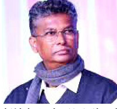
ದೆಹಲಿಗೆ ಹೋಗಿದ್ದಾರೆ. ಅವರು ವರಿಷ್ಠರೊಂದಿಗೆ ಚರ್ಚೆ ನಡೆಸಲಿದ್ದಾರೆ. ಏನೇ ನಿರ್ಧಾರ ತೆಗೆದುಕೊಂಡರೂ ನಾನು ಸ್ವೀಕರಿಸುತ್ತೇನೆ. ಸಿದ್ದರಾಮಯ್ಯ ದೆಹಲಿಯಿಂದ ವಾಪಾಸಾದ ನಂತರ ಸೋ ಮಾತು

ಬೆಂಗಳೂರು: ನಿರ್ಗಮಿತ ಸಚಿವ ಸತೀಶ್ ಜಾರಕಿಹೊಳೆ ಕೆಪಿಸಿಸಿ ಅಧ್ಯಕ್ಷರಾಗಿ ನೇಮಕ ಆಗಲಿದ್ದಾರೆ ಎಂಬ ಮಾತನ್ನು ಉಹಾಪೋಹ ಎಂದು ಸತೀಶ್ ಅವರು ತಳ್ಳಿಹಾಕಿದ್ದಾರೆ. ಮುಖ್ಯಮಂತ್ರಿ ಸಿದ್ದರಾಮಯ್ಯ ಮತ್ತು ಉಪ ಮುಖ್ಯಮಂತ್ರಿ ಡಿ.ಕೆ.ಶಿವಕುಮಾರ್ ಅವರು ಪಕ್ಷದ ಹೈಕಮಾಂಡ್ ಜೊತೆ ಚರ್ಚಿಸಿ ದೆಹಲಿಯಿಂದ ಹಿಂದಿರುಗಿದ ನಂತರವೇ ಅಂತಿಮ ನಿರ್ಧಾರ ಹೊರಬೀಳಲಿದೆ ಎಂದು ಅವರು ತಿಳಿಸಿದರು. ನಗರದಲ್ಲಿ ಶುಕ್ರವಾರ ಸುದ್ದಿಗಾರರೊಂದಿಗೆ ಮಾತನಾಡಿದ ಅವರು, ಸೋನಿಯಾ ಗಾಂಧಿ ಮತ್ತು ರಾಹುಲ್ ಗಾಂಧಿ ಸೇರಿದಂತೆ ಹಿರಿಯ ನಾಯಕರೊಂದಿಗೆ ಸಮಾಲೋಚನೆ ನಡೆಸಿದ ನಂತರ ಪಕ್ಷದ ನಾಯಕರು ಅಂತಿಮ ನಿರ್ಧಾರ ತೆಗೆದುಕೊಳ್ಳಲಿದ್ದಾರೆ ಎಂದು ತಿಳಿಸಿದರು. ಸಿದ್ದರಾಮಯ್ಯ ಮತ್ತು ಡಿ.ಕೆ.ಶಿವಕುಮಾರ್