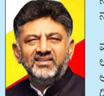
ಪುಸ್ತಕ ಯಾವುದೇ ಮಾಹಿತಿಯನ್ನು ಅವರು ಬಹಿ ರಂಗಪಡಿಸಿಲ್ಲ. ಎಲ್ಲವನ್ನೂ ಹಂತ ಹಂತವಾಗಿ ನಡೆಸಲಾಗುವುದು ಎಂದು ಅವರು ತಿಳಿಸಿದರು.

ನವದೆಹಲಿ: ಮೂರು ದಿನಗಳಿಂದಲೂ ಮೌನವಾಗಿಿದ್ದ ಡಿ.ಕೆ.ಶಿವಕುಮಾರ್ ಶುಕ್ರವಾರ ಮೊದಲ ಬಾರಿಗೆ ಮಾಧ್ಯಮಗಳಿಗೆ ಹೇಳಿಕೆ ನೀಡಿದ್ದಾರೆ. ಹೈಕಮಾಂಡ್ ನಾಯಕರನ್ನು ಭೇಟಿಯಾದ ಬಳಿಕ ಮಾತನಾಡಿದ ಅವರು, ನಾಳೆ ಸಂಜೆ ಬೆಂಗಳೂರಿನಲ್ಲಿ ಶಾಸಕಾಂಗ ಪಕ್ಷದ ಸಭೆ ನಡೆಯಲಿದೆ. ಮೊದಲಿಗೆ ಶಾಸಕಾಂಗ ಪಕ್ಷದ ನಾಯಕರನ್ನು ಆಯ್ಕೆ ಮಾಡುವ ಪ್ರಕ್ರಿಯೆ ಪೂರ್ಣಗೊಳ್ಳಬೇಕು. ನಂತರವಷ್ಟೇ ಉಳಿದ ವಿಷಯಗಳ ಬಗ್ಗೆ ಚರ್ಚಿಸಲಾಗುವುದು ಎಂದು ಅವರು ಸ್ಪಷ್ಟಪಡಿಸಿದರು. ಪ್ರಮಾಣ ವಚನ ಸ್ವೀಕಾರದ ದಿನಾಂಕ ಅಥವಾ ಸಚಿವ ಸಂಪುಟ ರಚನೆಯ ಕುರಿತು ಪ್ರಸ್ತುತ ಯಾವುದೇ ಮಾಹಿತಿಯನ್ನು ಅವರು ಬಹಿ ರಂಗಪಡಿಸಿಲ್ಲ. ಎಲ್ಲವನ್ನೂ ಹಂತ ಹಂತವಾಗಿ ನಡೆಸಲಾಗುವುದು ಎಂದು ಅವರು ತಿಳಿಸಿದರು. ಡಿ.ಕೆ.ಶಿವಕುಮಾರ್ ಎಂಪಿಎಸ್ ಅಧ್ಯಕ್ಷ ಮಲ್ಲಿಕಾರ್ಜುನ ಖರ್ಗೆ ಅವರನ್ನು