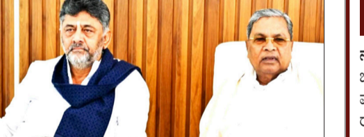
ರಣವಿನ್ಯಾಸ ಸುಜೀವಾಲಾ ಪ್ರತಿಕ್ರಿಯಿಸಿದ್ದಾರೆ. ಸಿಎಂ ಸ್ಥಾನಕ್ಕೆ ರಾಜೀನಾಮೆ ನೀಡುವಂತೆ ಸಿದ್ದರಾಮಯ್ಯ ಅವರಿಗೆ ಮಂಗಳವಾರ ಸೂಚಿಸಿದ್ದ ರಾಹುಲ್ ಗಾಂಧಿ, ಹೊಸ ಸರ್ಕಾರದಲ್ಲಿ ಮಗನಿಗೆ ಅವಕಾಶ ಕಲ್ಪಿಸುವುದಾಗಿ ಭರವಸೆ ನೀಡಿದ್ದರು ಎನ್ನಲಾಗಿದೆ.

ಬೆಂಗಳೂರು: ಮುಖ್ಯಮಂತ್ರಿ ಸಿದ್ದರಾಮಯ್ಯ ಸಂಪುಟದಲ್ಲಿ ಸುಮಾರು 20 ಸಚಿವರು ಡಿ.ಕೆ.ಶಿವಕುಮಾರ್ ಸಂಪುಟದಲ್ಲಿ ಸ್ಥಾನ ಕಳೆದುಕೊಳ್ಳುವ ಮುನ್ಸೂಚನೆ ಸಿಕ್ಕಿದೆ. ಸಿದ್ದರಾಮಯ್ಯ ಕ್ಯಾಬಿನೆಟ್‌ನಲ್ಲಿ ಕೇವಲ 10ರಿಂದ 12 ಸಚಿವರಿಗಷ್ಟೇ ಈ ಬಾರಿ ಅಧ್ಯಕ್ಷ ಒಲಿಯಲಿದೆ. ಉಳಿದವರಿಗೆ ಕೊಠ ನೀಡಲು ಹೈಕಮಾಂಡ್ ಗಂಭೀರ ಚಿಂತನೆ ನಡೆಸಿದೆ. ಇದರಲ್ಲಿ ಪ್ರಮುಖವಾಗಿ ಬೆಂಗಳೂರು ಭಾಗದ ಮೂವರು ಪ್ರಭಾವಿ ಸಚಿವರಿಗೆ ಮಂತ್ರಿಗಿರಿ ಕೈತ್ತವ್ಯವ ಸಾಧ್ಯತೆ ದಟ್ಟವಾಗಿದೆ ಎನ್ನಲಾಗಿದೆ. ತಮ್ಮ ಆಪ್ತ ನಾಯಕರಿಗೆ ಸಚಿವ ಸ್ಥಾನ ಕೈತ್ತವ್ಯವಿರುವ ಹಿನ್ನೆಲೆಯಲ್ಲಿ ಮುಖ್ಯಮಂತ್ರಿ ಸಿದ್ದರಾಮಯ್ಯ ಅಲರ್ಜ್ ಆಗಿದ್ದಾರೆ. ತಮ್ಮ ಬೆಂಬಲಿಗರಲ್ಲಿ ಕನಿಷ್ಠ 6ರಿಂದ 7 ಜನರಿಗಾದರೂ ಸಂಪುಟದಲ್ಲಿ ಅವಕಾಶ ನೀಡಬೇಕು ಎಂದು ಸಿದ್ದರಾಮಯ್ಯ ಹೈಕಮಾಂಡ್ ನಾಯಕರ ಮುಂದೆ ಬಿಗಿ ಪಟ್ಟು ಹಿಡಿದಿದ್ದಾರೆ ಎನ್ನಲಾಗಿದೆ. ಈ ಬಾರಿಯ ನೂತನ ಕ್ಯಾಬಿನೆಟ್ ಕೇವಲ ಪ್ರಭಾವದ ಆಧಾರದ ಮೇಲಲ್ಲ, ಬದಲಿಗೆ ಮೂರು ಪ್ರಮುಖ ಘರ್ಮ ಲಾಗಳ ಅಡಿಯಲ್ಲಿ ರಚನೆಯಾಗಲಿದೆ. ಸಿದ್ದರಾಮಯ್ಯ ಬೆಂಬಲಿಗರು, ಡಿ.ಕೆ.ಶಿವಕುಮಾರ್ ಆಪ್ತರು, ಹೈಕಮಾಂಡ್ ಒಲವುಳ್ಳ ನಾಯಕರ (ದೆಹಲಿ ನಾಯಕರ ನೇರ ಆಯ್ಕೆ) ಶಿಫಾರಸು ಅಡಿ ಆಯ್ಕೆಯಾಗಲಿದೆ. ಈ ಮೂರು ಸೂತ್ರಗಳ ಪೈಕಿ ಹೈಕಮಾಂಡ್ ಕಡೆಯಿಂದಲೇ ನೇರವಾಗಿ ಸುಮಾರು 20 ನಾಯಕರಿಗೆ ಮಂತ್ರಿಗಿರಿ ಸಿಗುವ ಸಾಧ್ಯತೆಯಿದೆ. ಭವಿಷ್ಯದಲ್ಲಿ ರಾಜ್ಯದಲ್ಲಿ ಪಕ್ಷ ಸಂಘಟನೆಯನ್ನು ಮತ್ತಷ್ಟು ಬಲಪಡಿಸುವ ಮತ್ತು ಯುವ ನಾಯಕತ್ವವನ್ನು ಮುಂಚೂಣಿಗೆ ತರುವ ದೃಷ್ಟಿಯಿಂದ ಹೈಕಮಾಂಡ್ ಈ ಬಾರಿ ಹೊಸ ಮುಖಗಳಿಗೆ ಹೆಚ್ಚಿನ ಮಣೆ ಹಾಕಲು ನಿರ್ಧರಿಸಿದೆ ಎನ್ನಲಾಗಿದೆ. ಹಲವು ಸಚಿವರ ತಲೆದಂಡದ ಭೀತಿ ನಡುವೆಯೂ, ತಮ್ಮ ಉತ್ತಮ ಕಾರ್ಯಕ್ರಮಕ್ಕೆ ಆಧಾರದ ಮೇಲೆ ಕೆಲವರು ಈ ಬಾರಿಯೂ ಮಂತ್ರಿ ಸ್ಥಾನ