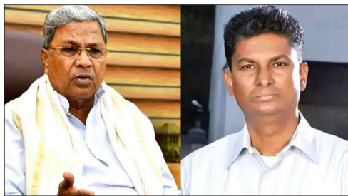
ದೆಹಲಿಯಲ್ಲಿ ಎಲ್ಲ ಮಾತುಕತೆ ಆಗಿರುವುದು. ಅವರು ಮಾತನಾಡುವಾಗ ಬೆಂಗಳೂರಿನಲ್ಲಿ ಏನೂ ಆಗಿಲ್ಲ. ನಮ್ಮನ್ನು ಯಾರೂ ಆಗಲೂ ಕೇಳಿರಲಿಲ್ಲ. ಎಲ್ಲ ಅವರೇ ನಿರ್ಧಾರ ಮಾಡಿಕೊಂಡ ಪ್ರಕಾರ ಸಿದ್ದರಾಮಯ್ಯ ಕೆಳಗೆ

ಬೆಂಗಳೂರು: ಸಿದ್ದರಾಮಯ್ಯ ವಿರುದ್ಧ ಸಹಿ ಸಂಗ್ರಹ ಎಂಬ ದೆಹಲಿ ಸುಳ್ಳು ಯಾರೋ ಹಾಕಿರುವ ಪೋಸ್ಟ್ ಮಹತ್ವ ಕೊಡುವ ಅಗತ್ಯವಿಲ್ಲ. ಯಾರೂ ಯಾವ ಸಹಿಯೂ ಹಾಕಿಲ್ಲ ಎಂದು ಸತೀಶ ಜಾರಕಿಹೊಳೆ ಹೇಳಿದರು. ಸಿದ್ದರಾಮಯ್ಯ ಆಪ್ತರೇ ಚೂರಿ ಹಾಕಿದರು ಎಂಬ ವಿಚಾರಕ್ಕೆ ಸುದ್ದಿಗಾರರಿಗೆ ಸ್ಪಷ್ಟನೆ ನೀಡಿದ ಅವರು, 37 ಜನರು ಸಿದ್ದರಾಮಯ್ಯ ವಿರುದ್ಧ ಸಹಿ ಹಾಕಿದ್ದರೆ ಉಳಿದ 100 ಮಂದಿ ಎಲ್ಲಿಗೆ ಹೋದರು? ಎಂದು ಪ್ರಶ್ನಿಸಿದರು. ಪೂರ್ವ ಒಪ್ಪಂದದ ಪ್ರಕಾರ ಅವರು ಕೆಳಗೆ ಇಳಿದಿದ್ದಾರೆ. ಯಾವಾಗಲಾದರೂ ಕೆಳಗೆ ಇಳಿಯಲೇಬೇಕು. ಈಗ ಅಥವಾ ಎರಡು ವರ್ಷ ಆದ ಮೇಲೆ. ಹಿಂದೆ ಬಂಗಾರಪ್ಪ, ದೇವರಾಜ್ ಅರಸು ಎಲ್ಲರೂ ಇಳಿದಿದ್ದರು ಎಂದು ಹೇಳಿದರು. ಸಿದ್ದರಾಮಯ್ಯ ಕೆಳಗೆ ಇಳಿಯಲೇಬೇಕು ನಾಯಕತ್ವ ವಿಚಾರ