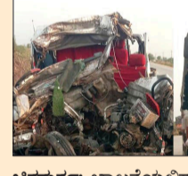
ಚಿತ್ರದುರ್ಗ: ಚಾಲನೆಯಲ್ಲಿದ್ದಾಗ ಕಾರಿನ ಟೈಯರ್ ಸ್ಪೋಟಗೊಂಡು ಲಾರಿಗೆ ಡಿಕ್ಕಿಯಾದ ಪರಿಣಾಮ ಐವರು ಸಾವನ್ನಪ್ಪಿರುವ ಘಟನೆ ಮೊಳಕಾಲ್ಮೂರು ತಾಲೂಕಿನ ತುಮಕೂರ್‌ಹಳ್ಳಿ ಗೇಟ್ ಬಳಿ ನಡೆದಿದೆ.