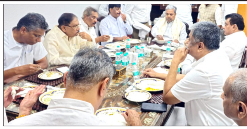
ಸಿವಂ ವಿದಾಯದ ಪೋಸ್ಟ್! ಚುನಾವಣಾ ಪೂರ್ವದಲ್ಲಿ ರಾಜ್ಯದ ಜನರೊಂದಿಗೆ ಸಿವಂ ಪ್ರತಿ ಮಾತಿಗೂ ಬದ್ಧರಾಗಿ ನಡೆಯುವ ಮೂಲಕ ನುಡಿದಂತೆ

ಬೆಂಗಳೂರು: ಸಿದ್ದರಾಮಯ್ಯ ಮುಖ್ಯಮಂತ್ರಿ ಸ್ಥಾನಕ್ಕೆ ಗುರುವಾರ ರಾಜೀನಾಮೆ ನೀಡುವುದು ಖಚಿತವಾಗಿದೆ. ಸಿದ್ದರಾಮಯ್ಯ ನಾಳೆ ಯಾವಾಗ ರಾಜೀನಾಮೆ ನೀಡುತ್ತಾರೆ ಎನ್ನುವ ಪ್ರಶ್ನೆಗೆ ಉತ್ತರಿಸುತ್ತಿದ್ದ ನಾಳೆ ಮಧ್ಯಾಹ್ನ 3 ಗಂಟೆಗೆ ಸಿದ್ದರಾಮಯ್ಯ ಲೋಕಭವನಕ್ಕೆ ತೆರಳಿ ರಾಜ್ಯಪಾಲರನ್ನು ಭೇಟಿಯಾಗಿ ರಾಜೀನಾಮೆ ಸಲ್ಲಿಸಲಿದ್ದಾರೆ. ಮುಖ್ಯಮಂತ್ರಿ ಸಿದ್ದರಾಮಯ್ಯ ಅವರು ಮೇ 28ರಂದು ಭೇಟಿಯಾಗಲು ರಾಜ್ಯಪಾಲ ಥಾವರ್‌ಚಂದ್ ಗೆಹಲೋತ್ ಅವರ ಸಮಯ ಕೋರಿದ್ದಾರೆ ಎಂದು ಮುಖ್ಯಮಂತ್ರಿ ಕಚೇರಿ ಮೂಲಗಳು ಬುದ್ಧವಾರ ತಿಳಿಸಿವೆ. ಸಿದ್ದರಾಮಯ್ಯ ಗೆಹಲೋತ್ ಅವರಿಗೆ ತಮ್ಮ ರಾಜೀನಾಮೆ ಸಲ್ಲಿಸಲಿದ್ದಾರೆ.