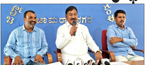
ನಗರದ ಜಿಲ್ಲಾ ಕಾರ್ಯನಿರತ ಪತ್ರಕರ್ತರ ಭವನದಲ್ಲಿ ಅಯೋಜಿಸಿದ ಸಂದವಾದಲ್ಲಿ ಮಾತನಾಡಿದರು. ಮುಖ್ಯಮಂತ್ರಿ ಸಿದ್ದರಾಮಯ್ಯ ಅವರು 3 ವರ್ಷಗಳ ಅವಧಿಯಲ್ಲಿ ಕ್ಷೇತ್ರಕ್ಕೆ ಹೆಚ್ಚಿನ ಅನುದಾನ ನೀಡಿದ್ದಾರೆ ಅದಕ್ಕಾಗಿ ಮುಖ್ಯಮಂತ್ರಿಗಳಿಗೆ ಈ ಮೂಲಕ ಅಭಿನಂದನೆ ಸಲ್ಲಿಸಲಾಗುವುದು ಎಂದು.

ಚಾಮರಾಜನಗರ: ರಾಜ್ಯ ಸರ್ಕಾರಕ್ಕೆ ಮೇ.20ಕ್ಕೆ 3 ವರ್ಷಗಳ ಪೂರೈಸಲಿದ್ದು, ಮೂರು ವರ್ಷಗಳ ಅವಧಿಯಲ್ಲಿ ಕೊಳ್ಳೇಗಾಲ ವಿಧಾನಸಭಾ ಕ್ಷೇತ್ರಕ್ಕೆ 500 ಕೋಟಿಗೂ ಹೆಚ್ಚು ಅನುದಾನ ತರಲಾಗಿದ್ದು ಕ್ಷೇತ್ರದ ಸಮಗ್ರ ಅಭಿವೃದ್ಧಿಗೆ ಹೆಚ್ಚಿನ ಒತ್ತು ನೀಡಲಾಗಿದೆ ಎಂದು ಕ್ಷೇತ್ರದ ಶಾಸಕ ಎ.ಆರ್. ಕೃಷ್ಣಮೂರ್ತಿ ಹೇಳಿದರು.