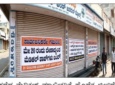
ಪಡೆದ ಮೆಡಿಕಲ್ ಮಾಲೀಕರಿಗೆ ಹೊಡೆತ ಬೀಳದೆ ಅಂತ ಮೆಡಿಕಲ್ ಮಾಲೀಕರು ಅಳಲು ತೋಡಿಕೊಂಡಿದ್ದಾರೆ. ಆನ್‌ಲೈನ್‌ನಲ್ಲಿ ಔಷಧಿ ಮಾರಾಟಕ್ಕೆ ಕೇಂದ್ರ ಸರ್ಕಾರ ಕೋವಿಡ್ ಸಮಯದಲ್ಲಿ ಅನುಮತಿಯನ್ನು ನೀಡಿದ್ದು, ಅದನ್ನೇ ಮುಂದುವರಿಸಿದ ಕೆಲ ಆಸ್ಪತ್ರೆಗಳಿಗೆ ಕಂಪನಿಗಳು ಬ್ಯುಸಿನೆಸ್ ಮಾಡಿಕೊಂಡಿವೆ. ಇದನ್ನು ವಿರೋಧಿಸಿ ಬಂದ್ ಗೆ ಕರೆ ನೀಡಲಾಗಿದೆ.

ಬೆಂಗಳೂರು: ರಾಜ್ಯದಾದ್ಯಂತ ಬುಧವಾರ ಮೆಡಿಕಲ್ ಶಾಪ್‌ಗಳು ಬಂದ್ ಆಗಲಿವೆ. ಐಓಟಿಎಸ್, ಸ್ಪಿಗಿ, ಜೋಮಾಟೋ ಇತರ ಆನ್‌ಲೈನ್ ಮೆಡಿಕಲ್ ಕೆಳ ಮೂಲಕ ಔಷಧಿಗಳ ಖರೀದಿ ಮಾಡಲು ನಿಲ್ಲಿಸುವಂತೆ ಆಗಿಹಿ ಸಿಬಿಲಿ ಭಾರತ ಔಷಧಿ ವ್ಯಾಪಾರಿಗಳ ಸಂಘದಿಂದ ದೇಶದಾದ್ಯಂತ ಮೆಡಿಕಲ್ ಶಾಪ್ ಬಂದ್‌ಗೆ ಕರೆ ಕೊಟ್ಟಿದೆ. ಕರ್ನಾಟಕದಲ್ಲೂ ಬಂದ್ ಬೆಂಬಲಿಸಿ ಮೆಡಿಕಲ್‌ಗಳನ್ನು ಬಂದ್ ಮಾಡಲಿದ್ದಾರೆ. ಕರ್ನಾಟಕದಲ್ಲಿಯೂ ಒಂದು ದಿನದ ಮಟ್ಟಿಗೆ ಸಂಪೂರ್ಣವಾಗಿ ಮೆಡಿಕಲ್‌ಗಳನ್ನು ಮುಚ್ಚಲು, ಕರ್ನಾಟಕ ಔಷಧಿ ಮಾರಾಟ ವ್ಯಾಪಾರಿಗಳ ಸಂಘದಿಂದ ಕರೆ ಕೊಡಲಾಗಿದೆ. ರಾಜ್ಯದಲ್ಲಿ 26,000 ಕ್ಕೂ ಹೆಚ್ಚು ಮೆಡಿಕಲ್‌ಗಳಿವೆ. ಮೇ 20ರಂದು ರಾತ್ರಿ 12 ಗಂಟೆಯಿಂದಲೇ ಬಂದ್‌ಗೆ ಕರೆ ನೀಡಲಾಗಿದೆ. ವಿವಿಧ ಆಸ್ಪತ್ರೆಗಳಿಂದ ಔಷಧಿಗಳ ಮಾರಾಟ ಆಗ್ಗಿದೆ. ಇದು ನೋಂದಣಿ