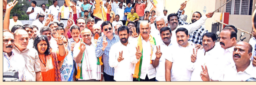
ಅವರಿಗೆ ತಕ್ಕಪಾಠ ಕಲಿಸಿದ್ದಾರೆ ಎಂದರು.

ಮೈಸೂರು: ಪಶ್ಚಿಮ ಬಂಗಾಳ ಸೇರಿ ಮೂರು ರಾಜ್ಯಗಳಲ್ಲಿ ಬಿಜೆಪಿ ಗೆಲುವು ಸಾಧಿಸಿದ ಹಿನ್ನೆಲೆಯಲ್ಲಿ ಮೈಸೂರಿನ ಬಿಜೆಪಿ ಕಚೇರಿಯಲ್ಲಿ ಕಾರ್ಯಕರ್ತರು ಪಟಾಕಿ ಸಿಡಿಸಿ, ಸಿಟಿ ಹಂಚಿ ಸಂಭ್ರಮಿಸಿದರು.