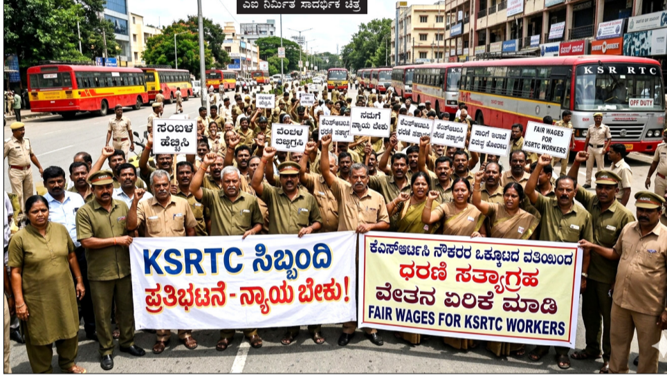
KSRTC ಸಿಬ್ಬಂದಿ ಪ್ರತಿಭಟನೆ-ನ್ಯಾಯ ಬೇಕು!

ಬೆಂಗಳೂರು: ಸಾರಿಗೆ ನೌಕರರು ಮತ್ತು ಸರ್ಕಾರದ ನಡುವಿನ ಮಾತುಕತೆ ವಿಫಲವಾದ ಹಿನ್ನೆಲೆಯಲ್ಲಿ ಸಾರಿಗೆ ನೌಕರರು ಮತ್ತೆ ಹೋರಾಟದ ಹಾದಿ ಹಿಡಿದಿದ್ದಾರೆ. ಮೇ 20ರಿಂದ ರಾಜ್ಯ ಸಾರಿಗೆ ಸ್ವಲ್ಪವಾಗಲಿದೆ. ಕೆಎಸ್ಆರ್‌ಟಿಸಿ, ಬಿಎಂಟಿಸಿ ಸೇರಿ ನಾಲ್ಕು ನಿಗಮಗಳ ಬಸ್‌ಗಳು ರಸ್ತೆಗಳ ಸರಿದೂಗಲು ನಿರ್ಧರಿಸಲಾಗಿದೆ. ಸಾರಿಗೆ ನೌಕರರು ಹಾಗೂ ಸರ್ಕಾರದ ನಡುವಿನ ಜಟಿಲ ಮಾತುಕತೆ ಜೋರಾಗಿದೆ. ವಿವಿಧ ಬೇಡಿಕೆಗಳ ಈಡೇರಿಕೆಗೆ ಆಗ್ರಹಿಸಿ ರಾಜ್ಯದ ನಾಲ್ಕು ನಿಗಮಗಳ ಸಾರಿಗೆ ನೌಕರರು ಒತ್ತಾಯ ಮಾಡಿದ್ದಾರೆ. ಈ ಬಾರಿ ಸರ್ಕಾರಕ್ಕೆ ಬಿಸಿ ಮುಟ್ಟಿಸಲು ಸಾರಿಗೆ ನೌಕರರು ಮುಂದಾಗಿದ್ದಾರೆ. ನಗರದಲ್ಲಿ ಸಾರಿಗೆ ನೌಕರರ ಜಂಟಿ ಕ್ರಿಯಾ ಸಮಿತಿ ಪದಾಧಿಕಾರಿಗಳು ಶನಿವಾರ ಸುದ್ದಿಗೋಷ್ಠಿಯಲ್ಲಿ ಮಾತನಾಡಿ, ಮುಂದಿನ ಹೋರಾಟದ ಬಗ್ಗೆ ಮಾಹಿತಿ ನೀಡಿ