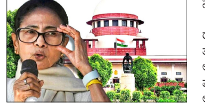
ಪ್ರಶ್ನಿಸಿದ್ದ ಅರ್ಜಿ ವಜಾ