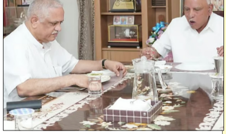
ಬಿ.ಎಸ್.ಯಡಿಯೂರಪ್ಪ ಮತ್ತು ಬಿ.ಎಲ್.ಸಂತೋಷ್

ಬೆಂಗಳೂರು: ಮಾಜಿ ಮುಖ್ಯಮಂತ್ರಿ, ಬಿಜೆಪಿ ರಾಷ್ಟ್ರೀಯ ಸಂಸದೀಯ ಮಂಡಳಿ ಸದಸ್ಯ ಬಿ.ಎಸ್. ಯಡಿಯೂರಪ್ಪ ಅವರನ್ನು ಬಿಜೆಪಿ ರಾಷ್ಟ್ರೀಯ ಸಂಘಟನಾ ಪ್ರಧಾನ ಕಾರ್ಯದರ್ಶಿ ಬಿ. ಎಲ್. ಸಂತೋಷ್ ಅವರು ಶನಿವಾರ ಭೇಟಿಯಾಗಿ ಮಾತುಕತೆ ನಡೆಸಿದರು. ಯಡಿಯೂರಪ್ಪ ಅವರು ರಾಜಕೀಯ ಜೀವನಕ್ಕೆ ಪದಾರ್ಪಣೆ ಮಾಡಿ ಐದು ದಶಕಗಳನ್ನು ಪೂರೈಸುತ್ತಿರುವ ಸಮಯದಲ್ಲಿ ಸಂತೋಷ್ ಅವರು ಭೇಟಿ ನೀಡಿ, ಅವರ ಜತೆಗೆ ಉಪಾಹಾರ ಸೇವಿಸಿದ್ದಾರೆ. ಈ ಕುರಿತು ಪ್ರತಿಕ್ರಿಯೆ ನೀಡಿದ ಬಿ.ಎಸ್. ಯಡಿಯೂರಪ್ಪ, ಪಕ್ಷವನ್ನು ರಾಷ್ಟ್ರಮಟ್ಟದಲ್ಲಿ ಸಮರ್ಥವಾಗಿ ಸಂಘಟಿಸುತ್ತಿರುವ ಬಿ.ಎಲ್.ಸಂತೋಷ್ ಅವರು ಮನೆಗೆ ಭೇಟಿ ನೀಡಿದ್ದು ಖುಷಿ ತಂದಿದೆ. ಅವರ ಸಂಘಟನಾ ಸಾಮರ್ಥ್ಯ ಚತುರತೆ ಪ್ರತಿಯೊಬ್ಬ ಕಾರ್ಯಕರ್ತನಿಗೂ ಸ್ಫೂರ್ತಿಯ ಸೆಲೆಯಾಗಿದೆ. ನನ್ನ ರಾಜಕೀಯ ಜೀವನದ 50ನೇ ವರ್ಷದ ಪಯಣಕ್ಕೆ ಶುಭಾಶಯ ತಿಳಿಸಲು ಆಗಮಿಸಿದ್ದರು ಎಂದು ಹೇಳಿದರು. ಈಚೆಗೆ ನಡೆದ ಪಂಚ ರಾಜ್ಯಗಳ ವಿಧಾನಸಭಾ