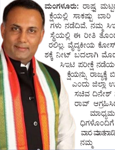
ಮಂಗಳೂರು: ರಾಜ್ಯ ಮಟ್ಟದ ಪರೀಕ್ಷೆಯಲ್ಲಿ ಸಾಕಷ್ಟು ಬಾರಿ ಹಗರಣಗಳು ನಡೆದಿವೆ. ನಮ್ಮ ಸಿಇಟಿ ವ್ಯವಸ್ಥೆಯಲ್ಲಿ ಈ ರೀತಿ ತೊಂದರೆ ಆಗಿರಲಿಲ್ಲ. ವೈದ್ಯಕೀಯ ಕೋರ್ಸ್‌ನಲ್ಲಿ ಶಕ್ತಿ ನೀಡಲು ಬದಲಾಗಿ ಮೊದಲಿನಂತೆ ಸಿಇಟಿ ಪರೀಕ್ಷೆ ನಡೆಯಲಿ. ಪರೀಕ್ಷೆಯನ್ನು ರಾಜ್ಯಕ್ಕೆ ಬಿಟ್ಟು ಬಿಡಿ ಎಂದು ಜಿಲ್ಲಾ ಉಸ್ತುವಾರಿ ಸಚಿವ ದಿನೇಶ್ ಗುಂಡೂರಾವ್ ಆಗ್ರಹಿಸಿದರು. ಮಾಧ್ಯಮ ಪ್ರತಿನಿಧಿಗಳೊಂದಿಗೆ ಶುಕ್ರವಾರ ಮಾತನಾಡಿದ ಅವರು, ನಮ್ಮ

ರಾಜ್ಯದ ವಿದ್ಯಾರ್ಥಿಗಳ ಹಿತರಕ್ಷಣೆ: ಸಚಿವ ಗುಂಡೂರಾವ್