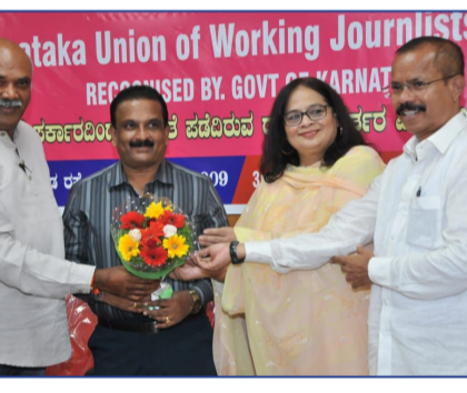
ಹೊರಡಿಸಲಾಗುವುದು. ಇದರಿಂದ ಆರು ಸಾವಿರಕ್ಕೂ ಹೆಚ್ಚಿನ ಪತ್ರಕರ್ತರಿಗೆ ಸವಲತ್ತು ಸಿಗುವ ಸಾಧ್ಯತೆಗಳಿವೆ ಎಂದು. ಪತ್ರಕರ್ತರ ಸಂಘ ಮತ್ತು ಪತ್ರಕರ್ತ ಸಮುದಾಯ ಅವರ ಒತ್ತಡದಿಂದಲೇ ರಾಜ್ಯದಲ್ಲಿ 'ಜಾಹಿರಾತು ನೀತಿ' ತರಲಾಗಿದೆ. ವ್ಯತಿಪರವಾಗಿ ಕಷ್ಟಪಟ್ಟು ಪತ್ರಿಕೆ ಮಾಡುವವರಿಗೆ ನೆರವಾಗಬೇಕು ಎನ್ನುವ ಕಾಳಜಿ ಜಾಹಿರಾತು ನೀತಿಯ ಹಿಂದಿರುಗಿಸಿರುವ ಜಾಹಿರಾತು ದರ ಪರಿಷ್ಕರಣೆ ಕೂಡ ಚರ್ಚೆಯಲ್ಲಿದೆ ಎಂದು.