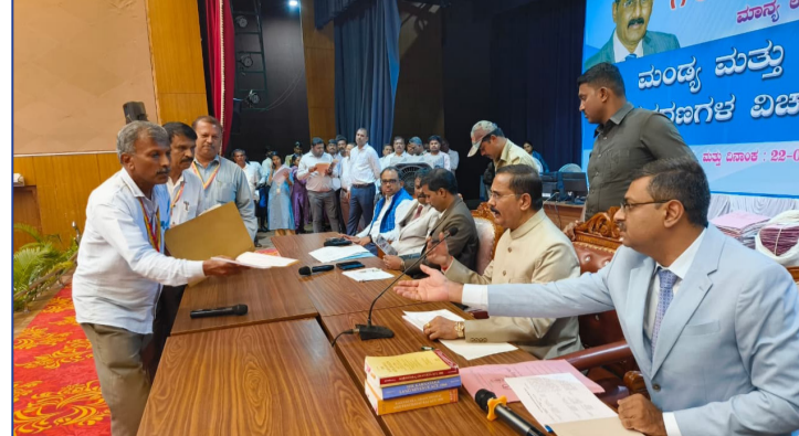
ಮಾಡಲು ಯಾರಿಂದಲೂ ಸಾಧ್ಯವಿಲ್ಲ. ಸರ್ವಜನಿಕರಿಗೆ ಅನ್ಯಾಯ ಆಗದಂತೆ ಕಾರ್ಯನಿರ್ವಹಿಸುತ್ತೇವೆ ಎಂದರು. ಅಧಿಕಾರಿಗಳು ಕೆಲಸ ಕಾರ್ಯಗಳಲ್ಲಿ