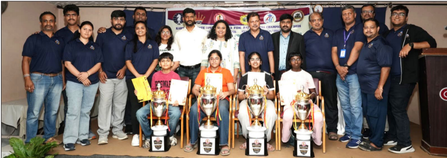
ಬಾಲಕಿಯರ ಹಿಂದಕ್ಕೆ ಸಮಗ್ರ ಚಾಂಪಿಯನ್ ಆಗಿ ಹೊರಹೊಮ್ಮಿದರು.

ರಾಜ್ಯದ 17 ಜಿಲ್ಲೆಗಳಿಂದ ಒಟ್ಟು 394 ಬಾಲ ಪ್ರತಿಭೆಗಳು ಈ ಕೂಟದಲ್ಲಿ ಭಾಗವಹಿಸಿದ್ದರು. ಮುಕ್ತ ವಿಭಾಗದಲ್ಲಿ 260 ಹಾಗೂ ಬಾಲಕಿಯರ ವಿಭಾಗದಲ್ಲಿ 134 ಸ್ಪರ್ಧಿಗಳು ತಮ್ಮ ಚಾಣಾಕ್ಷತನ ಮೆರೆದರು.