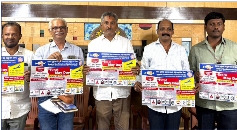
ಉಪಮುಖ್ಯಮಂತ್ರಿ ಡಿ.ಕೆ. ಶಿವಕುಮಾರ್, ಸಾರಿಗೆ ಸಚಿವ ರಾಮಲಿಂಗಾ ರೆಡ್ಡಿ, ಕಾರ್ಮಿಕ ಸಚಿವ ಸಂತೋಷ್ ಲಾಡ್ ಮತ್ತಿತರರು ಸಮಾವೇಶದಲ್ಲಿ ಭಾಗವಹಿಸಲಿದ್ದಾರೆ. ಇದು ದ್ವಿಚಕ್ರ ವಾಹನ ತಂತ್ರಜ್ಞರ ಕ್ಷೇತ್ರದಲ್ಲಿ ದೇಶದ ಮಟ್ಟದಲ್ಲಿ ನಡೆಯುವ ಅತಿ ದೊಡ್ಡ

ಬೆಂಗಳೂರು: ಕರ್ನಾಟಕ ದ್ವಿಚಕ್ರವಾಹನ ಕಾರ್ಯಗಾರ ಮಾಲೀಕರು ಮತ್ತು ತಂತ್ರಜ್ಞರ ಸಂಘ ದಿಂದ ಮೇ 1 ರಂದು ಕಾರ್ಮಿಕ ದಿನಾಚರಣೆಯ ಅಂಗವಾಗಿ ಬೆಂಗಳೂರಿನ ಅರಮನ ಮೈದಾನದಲ್ಲಿ ಆಲ್ ಇಂಡಿಯಾ ಬೈಕ್ ಮೆಕ್ಯಾನಿಕ್ ಅಸೋಸಿಯೇಷನ್ ಬೃಹತ್ ಸಮಾವೇಶ ಆಯೋಜಿಸಲಾಗಿದೆ ಎಂದು ಸಂಘದ ರಾಜ್ಯಾಧ್ಯಕ್ಷ ಕೆ.ಎಸ್. ಪ್ರಸನ್ನ ಕುಮಾರ್ ಗೌಡ ಹೇಳಿದ್ದಾರೆ. ದೇಶದ ವಿವಿಧ ಭಾಗಗಳಿಂದ 12,500ಕ್ಕೂ ಅಧಿಕ ಮೆಕ್ಯಾನಿಕ್ ಗಳು ಭಾಗವಹಿಸುವ ನಿರೀಕ್ಷೆಯಿದ್ದು, ಅರಮನ ಮೈದಾನದ ಗೇಟ್ ನಂ.5ರ ಕಿಂಗ್, ಕೋರ್ಟ್ ಪ್ಯಾಲೆಸ್ನಲ್ಲಿ ಮೊದಲ ಆಗಮಿಸುವ 500 ಮಂದಿಗೆ ಉಚಿತವಾಗಿ ಬೈಕ್ ಜನರಲ್ ಸರ್ವಿಸ್ ಮತ್ತು ಆಯಲ್ ಚೇಂಜ್ ಮಾಡಿಕೊಡಲಾಗುವುದು. ಜೊತೆಗೆ ದ್ವಿಚಕ್ರ ವಾಹನಗಳ ಅತ್ಯಾಧುನಿಕ ಬಿಡಿ ಪರಿಕರಗಳ ವೈವಿಧ್ಯಮಯ ಪ್ರದರ್ಶನ ಏರ್ಪಡಿಸಲಾಗಿದೆ ಎಂದರು. ಸಭಾಧ್ಯಕ್ಷ ಯು.ಟಿ. ಖಾದರ್ ಸಮಾವೇಶ ಉದ್ಘಾಟಿಸಲಿದ್ದು, ಮುಖ್ಯಮಂತ್ರಿ ಸಿದ್ದರಾಮಯ್ಯ,