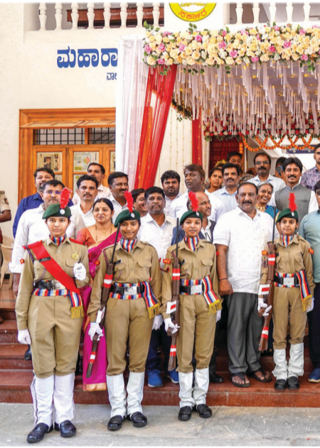
ಮಹಿಳೆಯರು ಸಬಲರಾಗಬೇಕು ಎಂದು ಡಾ. ಬಿ.ಆರ್. ಅಂಬೇಡ್ಕರ್ ಅವರು ಕಂಡ ಕನಸನ್ನು

ಮೈಸೂರು: ಹೆಣ್ಣು ಮಕ್ಕಳು ವೈಜ್ಞಾನಿಕ ಮತ್ತು ವೈಚಾರಿಕ ಶಿಕ್ಷಣವನ್ನು ಪಡೆದು ದೇಶಕ್ಕೆ ಒಳ್ಳೆಯ ಪ್ರಜೆಗಳಾಗಬೇಕು ಎಂದು ಸಮಾಜ ಕಲ್ಯಾಣ ಮತ್ತು ಜಿಲ್ಲಾ ಉಸ್ತುವಾರಿ ಸಚಿವ ಡಾ.ಹೆಚ್.ಸಿ ಮಹದೇವಪ್ಪ ಹೇಳಿದರು.