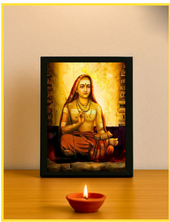
ಭಿನ್ನಸಂಶಯಾಃ - ಸತ್ಯವು ಮಾತುಗಳಿಗೆ ನಿಲುಕದ್ದು, ಅದು ಅನುಭವಕ್ಕೆ ಬರಬೇಕಾದ್ದು ಎಂಬುದನ್ನು ಮೌನದ ಮೂಲಕ ಗುರುಗಳು ಬೋಧಿಸುತ್ತಾರೆ.