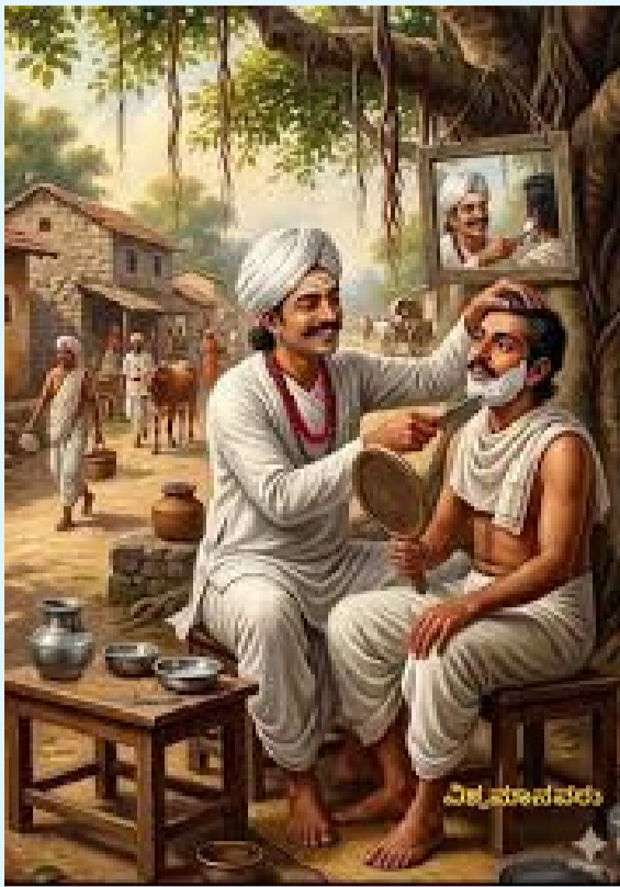
ಬಹುತೇಕ ಶರಣರಂತೆ ಅಮ್ಮ ದೇವಯ್ಯನವರು ಕೂಡ ತಮ್ಮ ಕಾಯಕದ ಉಪಕರಣಗಳನ್ನು ಅಧ್ಯಾತ್ಮಿಕ ಸಂಕೇತಗಳಾಗಿ ಪರಿವರ್ತಿಸಿ

ಕನ್ನಡಿಯನ್ನು ಹಿಡಿಯುವುದು ಹಾಗೂ ಕೈರ ಮಾಡುವುದು. ಕೈರ ಮಾಡಿಕೊಳ್ಳುವುದು ಪ್ರತಿಯೊಬ್ಬ ವ್ಯಕ್ತಿಗೆ ಅನಿವಾರ್ಯವಾದರೂ, ಕೈರಿಕರಲ್ಲದ ತಮ್ಮ ಬದುಕು ನಡೆಯುವುದಿಲ್ಲ ಎಂಬುದು ಗೊತ್ತಿದ್ದರೂ ಕೂಡ ಕೈರ ವೃತ್ತಿಯನ್ನು ಕೈಗೊಳ್ಳುವವರನ್ನು ಅತ್ಯಂತ ಕೀಳಾಗಿ ನೋಡುತ್ತಿದ್ದ ಅಂದಿನ ಕಾಲದಲ್ಲಿ ಅಣ್ಣ ಬಸವಣ್ಣನವರು ಅಮ್ಮದೇವಯ್ಯನವರಿಗೆ ಅನುಭವ ಮಂಟಪದಲ್ಲಿ ಸಮಾನ ಸ್ಥಾನವನ್ನು ನೀಡಿ ಗೌರವಿಸಿದ್ದರು.. ಆದೊಂದು ಕ್ರಾಂತಿಕಾರಕ ನಡೆಯಾಗಿತ್ತು. ಮುಂದೆ ಅಮ್ಮದೇವಯ್ಯನವರು ತಮ್ಮ ನಡೆ-ನುಡಿಗಳ ಮೂಲಕ ಅನುಭವ ಮಂಟಪದ ಮುಖ್ಯಸ್ಥರಲ್ಲಿ ಒಬ್ಬರಾಗಿದ್ದರು.