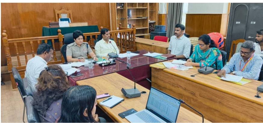
ಜಿಲ್ಲಾಧಿಕಾರಿಗಳು ತಿಳಿಸಿದರು, ಸಾರ್ವಜನಿಕರು ಗೃಹ ಬಳಕೆ ಅನಿಲ ಮುಂಗಡ ಬುಕಿಂಗ್ ಮಾಡಿದಾಗ ಏಜೆನ್ಸಿ ಅವರು ನಿಯಮಾನುಸಾರ ಹಾಗೂ ಆದ್ಯತೆಯ ಮೇರೆಗೆ ವಿತರಣೆ ಮಾಡಬೇಕು.

ಬುಧವಾರ ಜಿಲ್ಲಾಧಿಕಾರಿಗಳ ಕಚೇರಿಯಲ್ಲಿ ಉಗ್ರಾ, ಕೆಆರ್ ಮತ್ತು ಸಿಬಿಆರ್ ಅನಿಲ ವಿತರಣೆ ಕಂಪನಿಯ ಮಾರಾಟಗಾರರಿಗೊಂದಿಗೆ ಸಭೆ ನಡೆಸಿ ಮಾತನಾಡಿದರು. ಜಿಲ್ಲೆಯಲ್ಲಿ 34 ಅನಿಲ ವಿತರಣೆ ಕಂಪನಿಯ ಮಾರಾಟಗಾರರು ಇದ್ದು ಆಹಾರ ಇಲಾಖೆಯ ಅಧಿಕಾರಿಗಳು ನಿಯಮಾನುಸಾರ ಸ್ಪಷ್ಟ ಹೋಗಿ ಸ್ಪಷ್ಟ ಪರಿಶೀಲನೆ ಮಾಡಬೇಕು, ಆಕ್ರಮ ಮಾರಾಟ ಮಾಡುವುದು, ಕಾಳಸಂಜೆಯಲ್ಲಿ ಮಾರಾಟ ಮಾಡುವುದು ಕಂಡುಬಂದರೆ ಕಾನೂನು ರೀತಿ ಕ್ರಮ ಕೈಗೊಳ್ಳಲಾಗುವುದು ಎಂದು