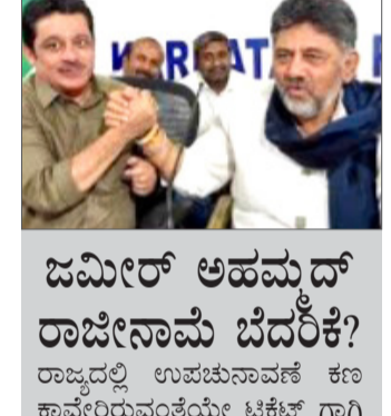
ಲಿಂಗಾಯತ ಕಾಂಗ್ರೆಸ್ ನಾಯಕರ ಅಸಮಾಧಾನ ಬೆಂಗಳೂರು: ದಾವಣಗೆರೆ ದಕ್ಷಿಣ ಕ್ಷೇತ್ರದ ಟಿಕೆಟ್ ಹಂಚಿಕೆ ವಿಚಾರ ಕಾಂಗ್ರೆಸ್ ಹೈಕಮಾಂಡ್‌ಗೆ ತಲೆನೋವಾಗಿದೆ. ಮುಸ್ಲಿಂ ಸಮುದಾಯದ ನಾಯಕರ ವಿರುದ್ಧ ಲಿಂಗಾಯತ ಸಮುದಾಯದ ನಾಯಕರು ಅಸಮಾಧಾನ ವ್ಯಕ್ತಪಡಿಸಿದ್ದಾರೆ.