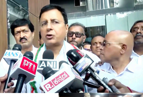
ಪರಿಗಣನೆಗೆ ತೆಗೆದುಕೊಂಡಿದ್ದೇವೆ. ಶುಕ್ರವಾರ ತಡರಾತ್ರಿವರೆಗೂ ಟಿಕೆಟ್ ವಿಚಾರವಾಗಿ ಚರ್ಚೆ ಮಾಡಿದ್ದೇವೆ. ಎಲ್ಲರ ಅಭಿಪ್ರಾಯಗಳನ್ನು ಕೇಳಿದ್ದೇವೆ ಎಂದು ಸ್ಪಷ್ಟಪಡಿಸಿದರು. ಇನ್ನು ರಾಜ್ಯಸಭಾ ಸದಸ್ಯ ನಾಸೀರ್ ಹುಸೇನ್ ಪ್ರತಿಕ್ರಿಯಿಸಿ, ಯಾರಾದರೂ ಆಕಾಂಕ್ಷಿಗಳು ಇದ್ದಾರೆ ಎಲ್ಲರೂ ಹೋಗಿ ಸಿಎಂ, ಡಿಎಂ, ಸುಜೇವಾಲ, ಏರ್.ಭೀಟಿ ಆಗಿದ್ದಾರೆ. ನಮ್ಮ ವೀಕ್ಷಕರು ಹೋಗಿ ಸರ್ವೆ ಮಾಡಿದ್ದಾರೆ.

ಬೆಂಗಳೂರು: ಕಾಂಗ್ರೆಸ್ ಪಕ್ಷ ಯಾವುದೇ ಒಂದು ಸಮದಾಯವನ್ನು ನೆಚ್ಚಿಕೊಂಡಿಲ್ಲ. ಎರಡೂ ಕ್ಷೇತ್ರಗಳಲ್ಲಿ ಕಾಂಗ್ರೆಸ್ ಗೆಲ್ಲುವ ವಿಶ್ವಾಸವಿದೆ ಎಂದು ರಾಜ್ಯ ಉಸ್ತುವಾರಿ ರಂಧೀಪ್ ಸುಜೇವಾಲ ಅಭಿಪ್ರಾಯಪಟ್ಟರು. ಟಿಕೆಟ್ ನೀಡದಿದ್ದರೆ ಬಂಡಾಯ ವಾಗಿ ಸ್ಪರ್ಧಿಸಲು ಅಭ್ಯರ್ಥಿಯ ಸಮುದಾಯದ ನಾಯಕರೊಬ್ಬರು ಬೆದರಿಕೆ ಹಾಕಿರುವ ಬಗ್ಗೆ ಪ್ರಶ್ನೆಗೆ ಉತ್ತರಿಸಿದ ಅವರು, ಎಲ್ಲಾ ಸಮುದಾಯಗಳನ್ನು ಒಟ್ಟಿಗೆ ಕರೆದೊಯ್ಯಲಾಗುವುದು. ಯಾವುದೇ ಒಂದು ಸಮುದಾಯದ ಬೆದರಿಕೆಗೆ ಮಣಿಯಿಲ್ಲ ಎಂದು ಹೇಳಿದರು. ಕೆಎಸ್ಸಿ ಕಚೇರಿಯಲ್ಲಿ ಶನಿವಾರ ಮಾಧ್ಯಮಗಳ ಜೊತೆ ಮಾತನಾಡಿದ ಅವರು, ದಾವಣಗೆರೆ ದಕ್ಷಿಣ, ಬಾಗಲಕೋಟೆ ಕ್ಷೇತ್ರಗಳ ಉಪನಿರ್ದೇಶಕರಾದ ಕಾಂಗ್ರೆಸ್ ಟಿಕೆಟ್ ನಾಳೆ ಬೆಳಿಗ್ಗೆ ಒಳಗೆ ಘೋಷಣೆ ಮಾಡುತ್ತೇವೆ ಎಂದು ರಂಧೀಪ್ ಸುಜೇವಾಲ ತಿಳಿಸಿದರು. ಟಿಕೆಟ್ ವಿಚಾರವಾಗಿ ವ್ಯಾಪಕವಾಗಿ ಚರ್ಚೆ ಮಾಡಲಾಗಿದೆ. ಯಾವುದೇ ಒಬ್ಬ ಕಾರ್ಯಕರ್ತರ ಅಪಸ್ವರ ಇದ್ದರೂ ಕೂಡ