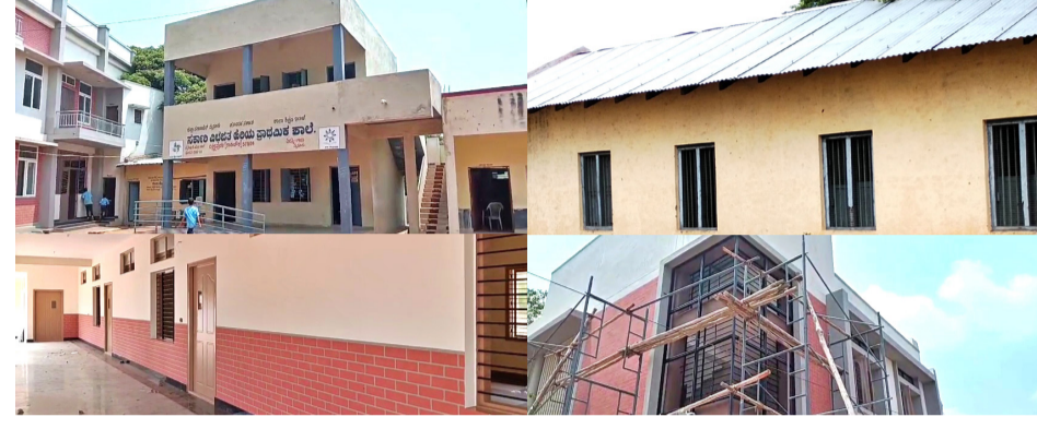
ದಿವ್ಯ ಶಾಲೆ ಮುಖ್ಯವ ಹಂತವನ್ನು ತಲುಪಿತು. ಅಂತಹ ಶಾಲೆಯ ಚಿತ್ರಣವೇ ಈಗ ಬದಲಾಗಿ ಯಾವುದೇ ಶಾಲೆಗೂ ಕಮ್ಮಿ ಇಲ್ಲ ಎಂಬಂತೆ ಸದ್ದು ಒಡೆದು ನಿಂತಿದೆ.

ವರ್ತಮಾನ ಶಿಕ್ಷಣ ಮೈಸೂರು: ಕೊಂಚ ಪಕ್ಕದೂರಿಗೆ ವರ್ಗಾವಣೆಗೊಂಡು ಹುಟ್ಟೂರನ್ನೇ ಮರೆಯುವ ಈ ಕಾಲದಲ್ಲಿಯೂ ವಿದೇಶದಲ್ಲಿ ನೆಲೆಸಿದ ಹಿರಿಯ ವಿದ್ಯಾರ್ಥಿ ಬಲದ ನೆರವಿನಿಂದ ಮೈಸೂರು ನಗರದ ಸರ್ಕಾರಿ ಪ್ರಾಥಮಿಕ ಶಾಲೆಯೊಂದರ ಸಂಪೂರ್ಣ ಚಿತ್ರಣ ಬದಲಾಗಿದೆ. 4 ಕೋಟಿಯಷ್ಟು ವ್ಯಯದೊಂದಿಗೆ ಶಾಲೆಯನ್ನು ಸಂಪೂರ್ಣವಾಗಿ ಪರಿಷ್ಕರಿಸಿ, ಅದರಲ್ಲಿ 100 ದಕ್ಕಿಗಳನ್ನು ಉಪಯೋಗಿಸಿ, ಶಾಲೆಯನ್ನು ಸುಸ್ಥಿರವಾಗಿ ಮಾಡಲಾಗಿದೆ.