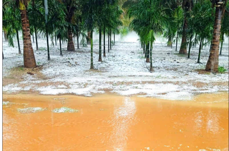
ವಾಹನ ಸವಾರರ ಪರದಾಟ

ಚಾಮರಾಜನಗರ, ಗಡಿ ಜಿಲ್ಲೆ ಚಾಮರಾಜನಗರದಲ್ಲಿ ಮಂಗಳ ವಾರ ಮಧ್ಯಾಹ್ನ ಒಂದು ತಾಸಿಗೂ ಅಧಿಕ ಕಾಲ ಭಾರಿ ಆಲಿಕಲು ಮಳೆ ಸುರಿದಿದ್ದು, ರಸ್ತೆ ತುಂಬಾ ಆಲಿಕಲು ಬಿದ್ದಿರುವುದು ಕಂಡುಬಂದಿದೆ. ಚಾಮರಾಜನಗರ ಜಿಲ್ಲಾ ಕೇಂದ್ರ ಸೇರಿದಂತೆ ತಾಲೂಕಿನ ಉಡಿಗಾಲ, ನಂಜೇದೇವನಪುರ, ಮರಿಯಾಲ, ಉತ್ತುವಳ್ಳಿ ಭಾಗದಲ್ಲಿ ಒಂದು ತಾಸಿಗೂ ಅಧಿಕ ಕಾಲ ಗುಡುಗು-ಸಿಡಿಲು ಗಾಳಿ ಸಹಿತ ಉಂಟಾದ ಜೋರು ಮಳೆಯ ಅವಾಂತರದಿಂದ ರೈತರು ಫಸಲುಗಳನ್ನು ಕಳೆದು