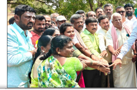
ಸುಮಾರು 40ಕ್ಕೂ ಹೆಚ್ಚು ಶಾಸಕರಿದ್ದೇವೆ. ಹಾಲಿ ಇರುವ 20 ಸಚಿವರನ್ನು ಬದಲಿಸಿ 20 ಮಂದಿ ಹೊಸ ಮುಖಗಳಿಗೆ ಅವಕಾಶ ನೀಡಿದರೆ ಮತ್ತಷ್ಟು

ಮುಮ್ಮಿನಿಂದ ಕೆಲಸ ಮಾಡುತ್ತಾರೆ. ಇದರಿಂದ ಪಕ್ಕಕ್ಕೆ ಮಾತ್ರವಲ್ಲ ಒಳ್ಳೆ ಹೆಸರು ಬರುತ್ತದೆ. ಈ ಹಿನ್ನೆಲೆಯಲ್ಲಿ ರಾಜ್ಯ ನಾಯಕರ ಮೂಲಕ ಹೈಕಮಾಂಡ್‌ಗೆ ಮನವಿ ಸಲ್ಲಿಸಿದ್ದೇವೆ ಎಂದು. ನಮ್ಮ ಮನವಿಗ ಮುಖ್ಯಮಂತ್ರಿ ಸಿದ್ಧರಾದಯ್ಯ ಅವರು ಸಹಾಯಕರಾಗಿ ಸ್ಪಂದಿಸಿದ್ದಾರೆ. ಎರಡು ಕ್ಷೇತ್ರಗಳ ಉಪ ಚುನಾವಣೆ ನಂತರ ಹೈಕಮಾಂಡ್ ಗಮನಕ್ಕೆ ತಂದು ಅರ್ಹರಿಗೆ ಸಚಿವ ಸ್ಥಾನ ನೀಡುವ ಭರವಸೆ ನೀಡಿದ್ದಾರೆ ಎಂದು ತಿಳಿಸಿದರು. ನಾಯಕತ್ವ ಬದಲಾವಣೆ ಆಗಬೇಕೆಂಬುದು ನಮ್ಮ ವ್ಯಾಪ್ತಿಯನ್ನು ಮೀರಿದ ವಿಚಾರ. ನಾಯಕತ್ವ ಬದಲಾಗಬೇಕೆ, ಬೇಡವೇ ಎಂಬುದನ್ನು