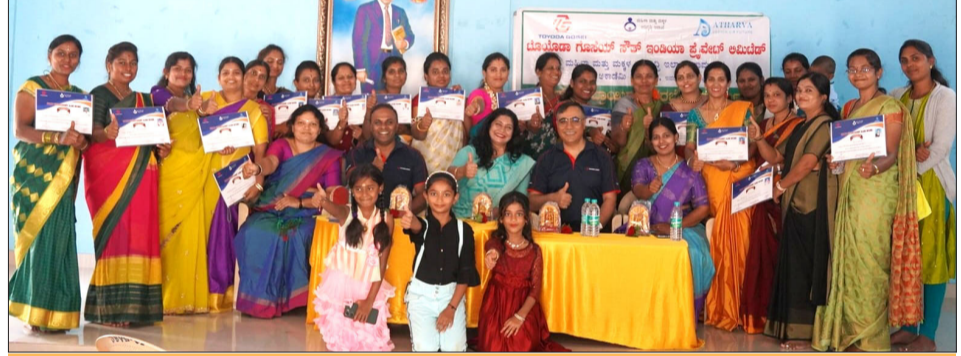
ಮಹಿಳೆಯರ ಸಬಲೀಕರಣಕ್ಕೆ ಬಜ್ ಇಂಡಿಯಾ ಕೊಡುಗೆ