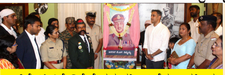
ಇನ್‌ಪೆಂಟ್ರಿ ಬ್ರಿಗೇಡಿಗೆ ನೇತೃತ್ವ ವಹಿಸಿ ವೈಕೃತ ಭಾರತೀಯ