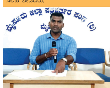
ಮೈಸೂರು ಜಿಲ್ಲಾ ಪ್ರತಿಭಾಕರ ನಂಘ (ಅ)

ಸರ್ಕಾರಿ ಕಚೇರಿ, ನಿಗಮ ಮಂಡಳಿಗಳಿಗೆ ಗುತ್ತಿಗೆ ಆಧಾರದ ಮೇಲೆ ವಾಹನ ಪಡೆಯುವ ವೇಳೆ ಕ್ರೀಡಾ ಕ್ಷೇತ್ರಗಳಲ್ಲಿ ಸಾಧನೆ ಮಾಡಿರುವವರಿಗೆ ಶೇ. 25 ಮೀಸಲಾತಿ ಕಲ್ಪಿಸಬೇಕು, ಪೌರ ಕಾರ್ಮಿಕರಿಗೂ ಆದ್ಯತೆ ನೀಡಬೇಕು, ಗ್ರಾಮೀಣ ಪ್ರದೇಶಗಳಿಗೆ ಭಾರ್ತ್ ಕ್ಯಾನ್ಸರ್ ಆಸ್ಪತ್ರೆಯ ಕ್ಯಾನ್ಸರ್ ಪತ್ರ ಸಂಚಾರಿ ಘಟಕ ಹೆಚ್ಚಾಗಿ ಭೇಟಿ ನೀಡುವಂತೆ ವ್ಯವಸ್ಥೆ ಮಾಡಬೇಕು, ಸರ್ಕಾರ ಗುತ್ತಿಗೆ ವಾಹನ ಪಡೆಯುವ ವೇಳೆ ಮದ್ಯತ್ ಚಾಲಿತ ವಾಹನಗಳನ್ನು ಕಡ್ಡಾಯಗೊಳಿಸಬೇಕು. ಕ್ಷೀರಭಾಗ್ಯ ಯೋಜನೆಗೆ ನಂದಿನಿ ಉತ್ಪನ್ನ ಸಿರಿಧಾನ್ಯ ಬಿಸ್ಕಿಟ್ ವಿತರಿಸಬೇಕೆಂದು ಸಹಾ ಸಲಹೆ ನೀಡಿದರು.